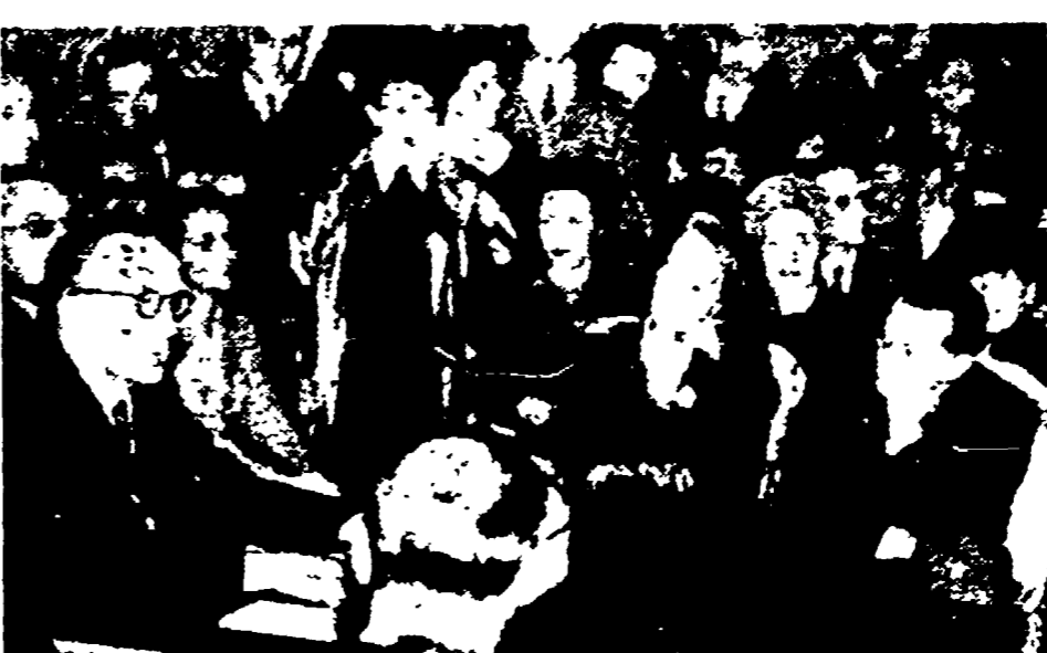
Paul Eluard, come contribuente alla sua conferenza, ha offerto ad infine a Roma.

« La coscienza dei poeti, arma nella lotta per la libertà. »