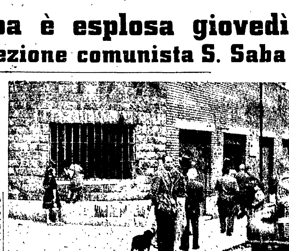
Subito dopo l'attentato i nostri compagni si recano a visitare la Sezione. A sinistra si nota l'inferriata della finestra sulla quale è stata deposta la bomba. Il muro è danneggiato. A destra si nota un'auto di Polizia.