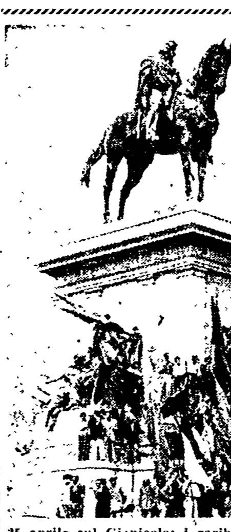
25 aprile sul Gianicolo: i carabinieri del nuovo Risorgimento intorno al monumento dell'Eroe repubblicano