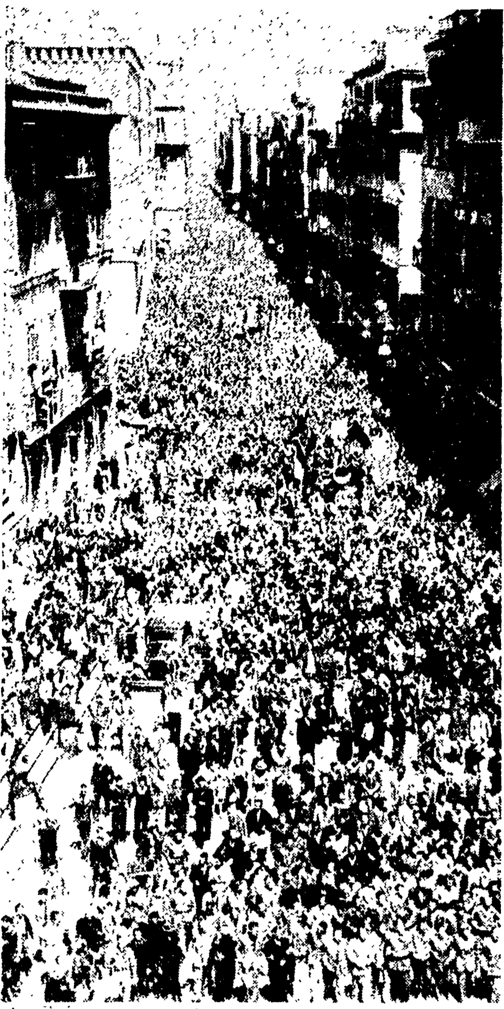
Da Piazza del Popolo al Viminale