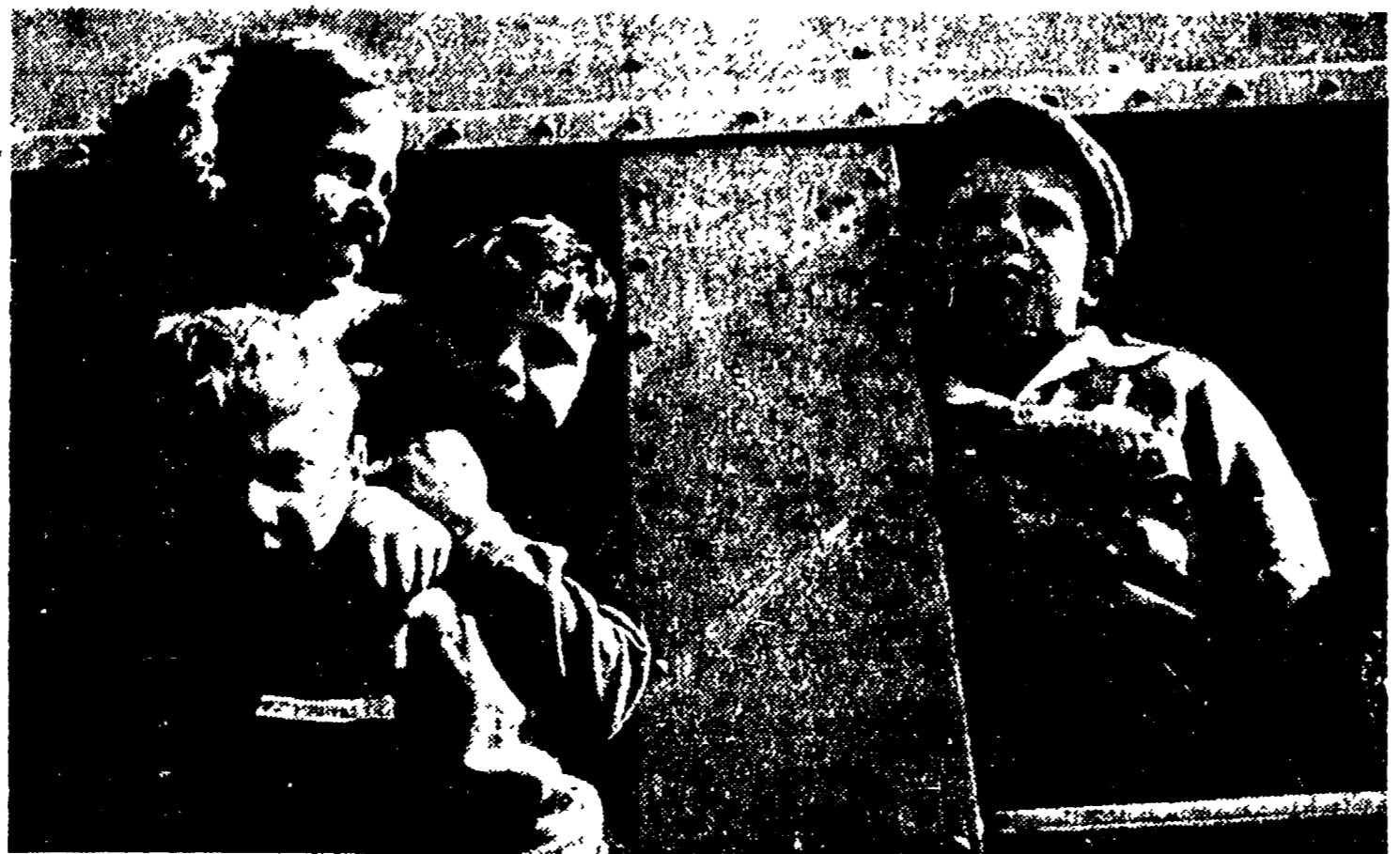
Ecco come noi comunisti smentiamo con fatti concreti le vergognose calunnie dei fascisti avversari.