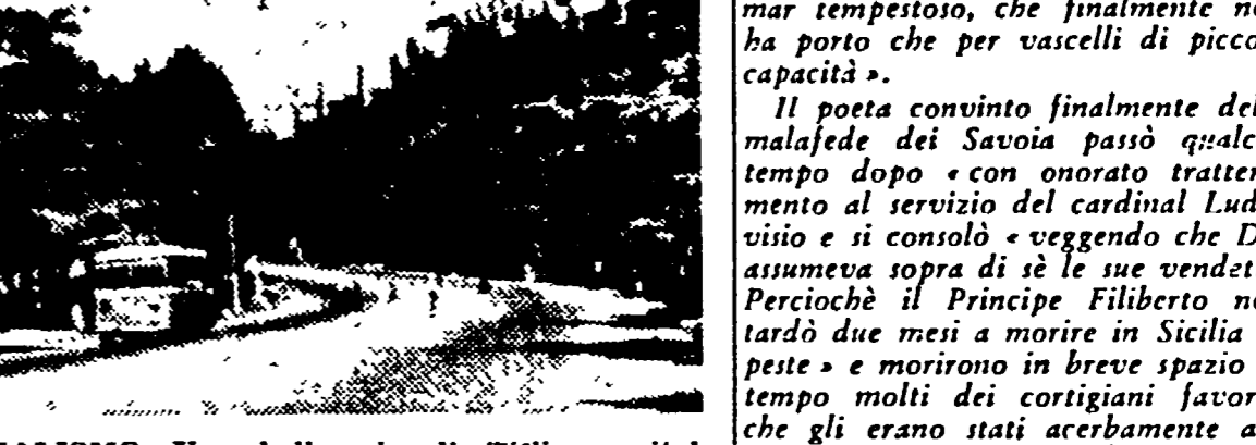
NEL PAESE DEL SOCIALISMO: Una bella via di Tiflis, capitale della Georgia

Il socialismo non toglie ma dà la terra e la proprietà ai contadini alla sola condizione che esse non servano allo sfruttamento di altri contadini.