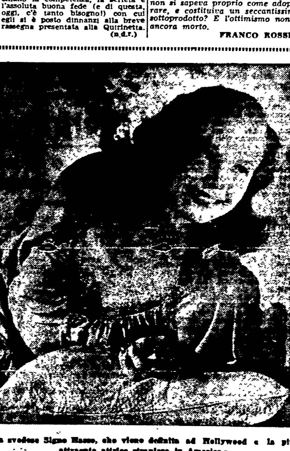
Il vedovo Signo Hasso, che viene defilato ad Hollywood e la più attrattiva attrice straniera in America.