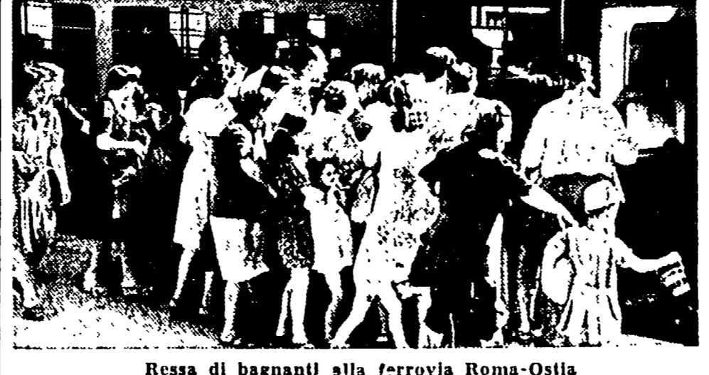
Resse di bagnanti alla ferrovia Roma-Ostia

Le condizioni pietose in cui si trova la stazione centrale di Roma non trovano neppure un'ombra di miglioramento in questi mesi.