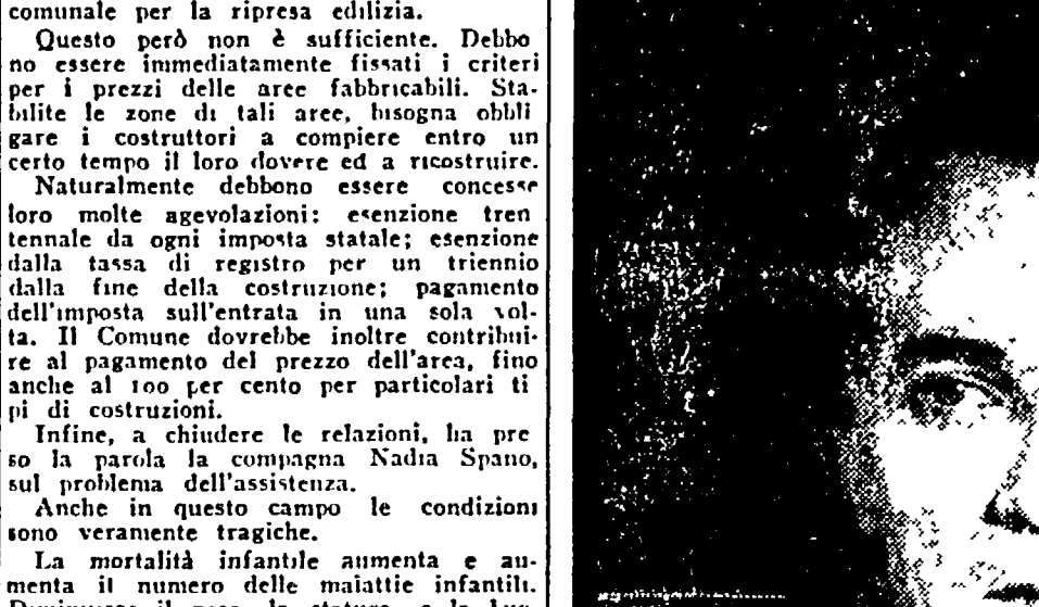
Il celebre basso GIULIO NERI del Teatro dell'Opera che tanto successo ha riportato nel corso della stagione lirica alle Terme di Caracalla, cantando domenica 2 settembre sotto la direzione del maestro Santarelli nella grande rappresentazione di "L'Alfideio" in apertura al mese di propaganda per la stampa comunista.