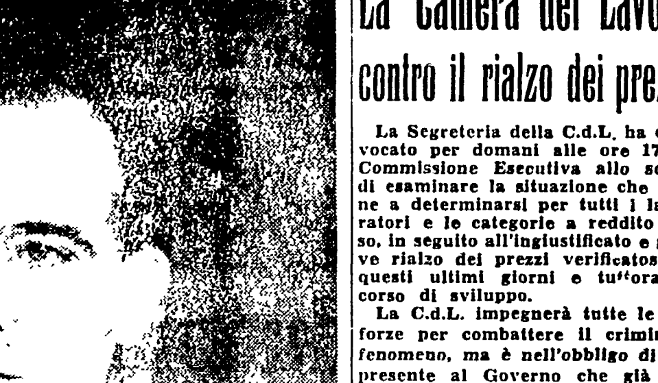
Il celebre basso GIULIO NERI del Teatro dell'Opera che tanto successo ha riportato nel corso della stagione lirica alle Terme di Caracalla, cantando domenica 2 settembre sotto la direzione del maestro Santarelli nella grande rappresentazione di "L'Alfideio" in apertura al mese di propaganda per la stampa comunista.