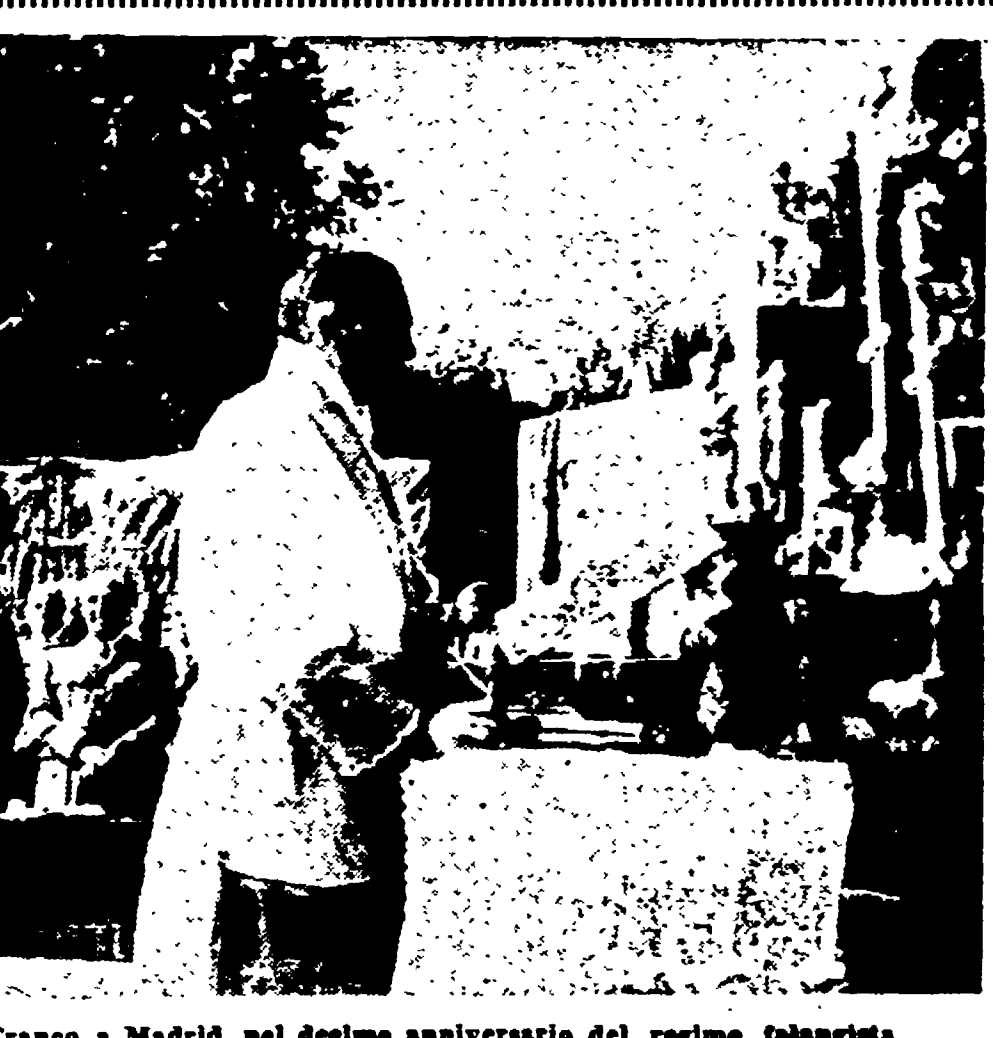
La più recente fotografia di Franco a Madrid, nel decimo anniversario del regime fascista

La seconda Sottocommissione per la Costituzione, riunita ieri a Montecitorio, si è occupata delle funzioni legislative delle due Camere. Si è in particolare modo discusso intorno alle norme da introdurre nella Costituzione per impedire che la seconda Camera faccia ostruzionismo alla prima, non esaminando le leggi da questa approvate... La Sottocommissione ha poi nominato un Comitato di sei membri incaricato di tradurre in articoli costituzionali i principi approvati in questi giorni. La riunione è stata quindi aggiornata al 5 novembre.