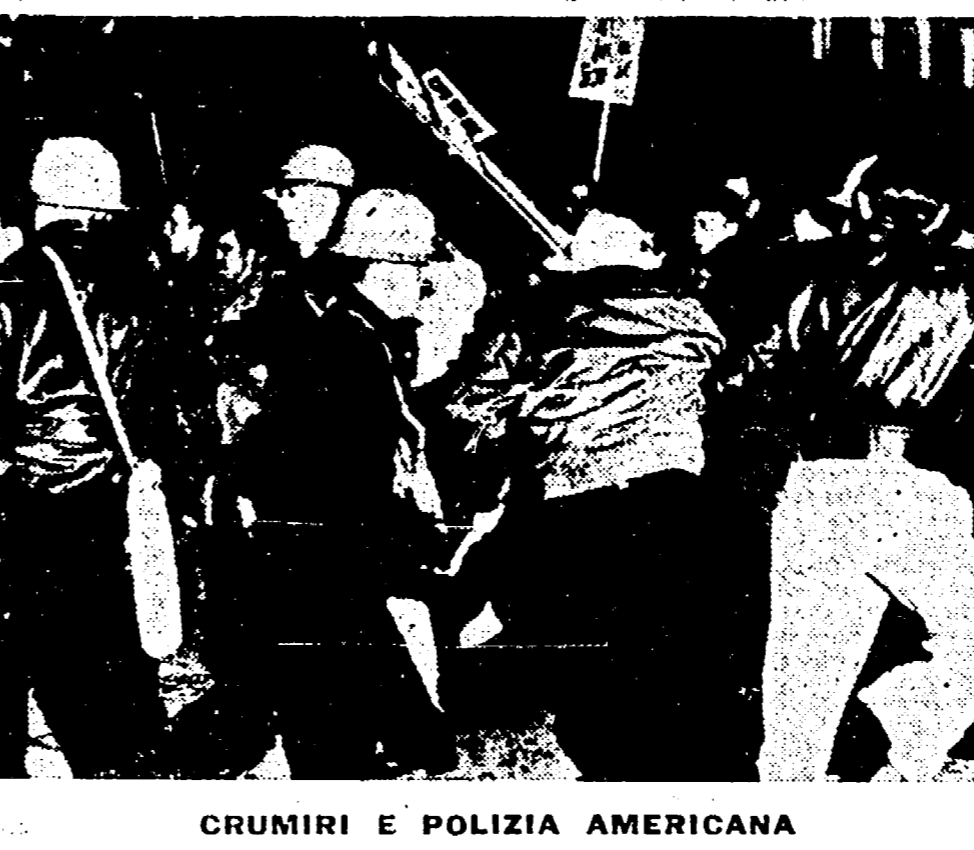
CRUMIRI E POLIZIA AMERICANA CONTRO I MINATORI IN SCIOPERO