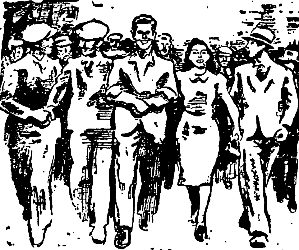
Vogliamo creare una forza organica...