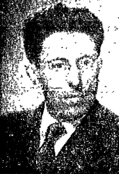
Il compagno Pietro Secchia

Milano è quella che ha il maggior numero di iscritti: 351.000. Stena è la prima in rapporto alla popolazione: 5100 iscritti e cioè il 19,3 per cento.