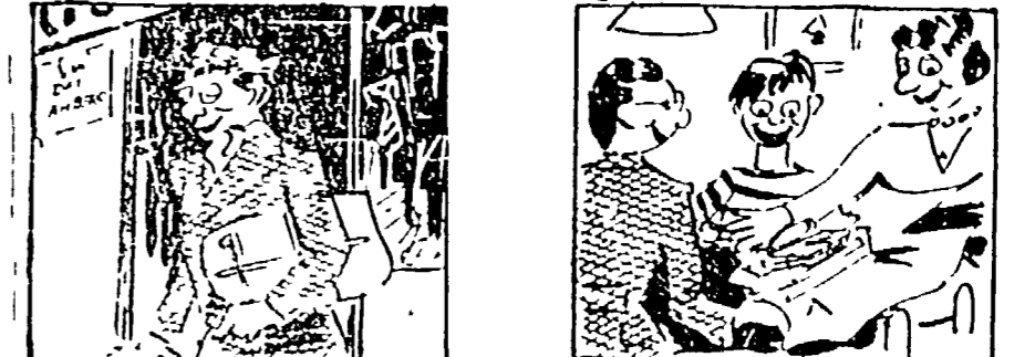
Non appena i prezzi dei vestiti scesero al «CROLO»... E' così che ritornare può la pace familiare!