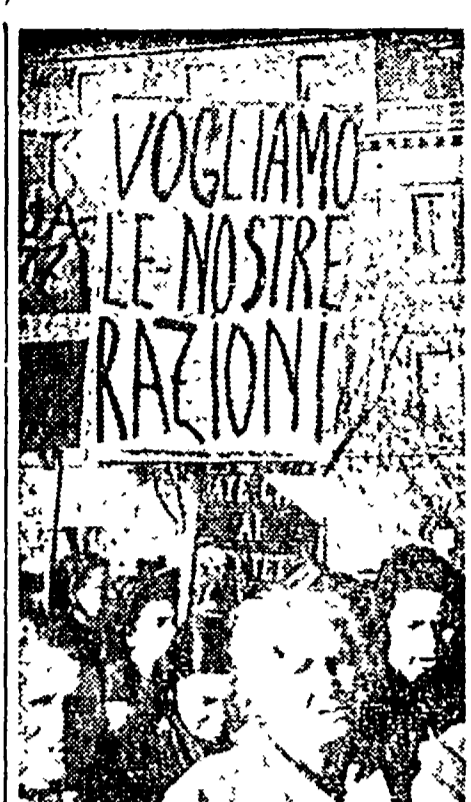
Le donne romane protestano in piazza Esquilino per la mancata distribuzione di grano razionato