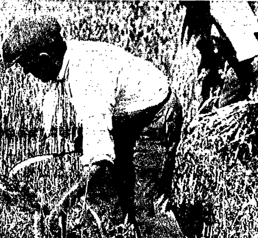
percepisce questo bracciano del grande latifondo dell'Agr. Romano. Quando ha chiesto un miglioramento salariale gli agrari hanno risposto offrendo il mero aumento di 20 lire giornaliere. Egli ora attende la solidarietà di tutti i lavoratori della città per vincere questa battaglia e portare la democrazia nelle campagne