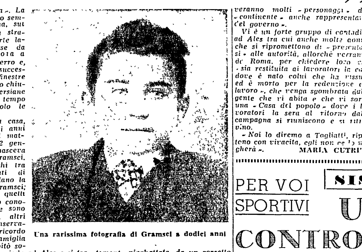
Una rarissima fotografia di Gramsci a dodici anni