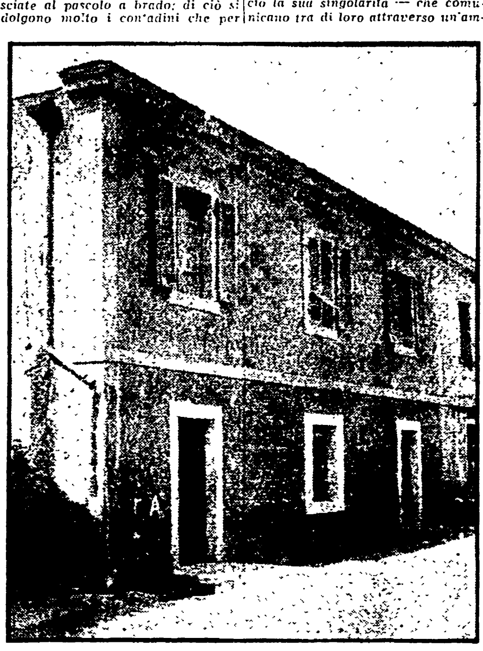
«La casa a due porte laterali divise da una ferola a sbarre...»

«Cinquantasei anni or sono». «La facciata esterna della Cattedrale è di approssimativa stile barocco...»