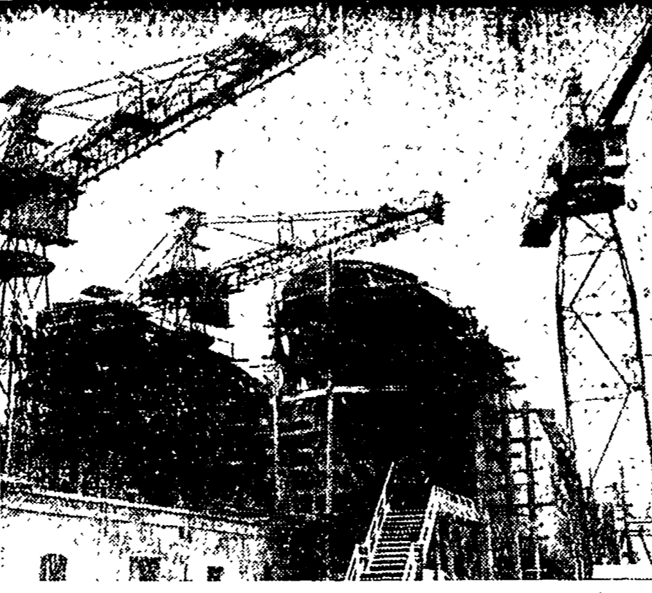
A Taranto gli operai dei Cantieri Tosi lavorano intensamente per la costruzione di navi mercantili e per la riparazione di tonnellaggio avariato...