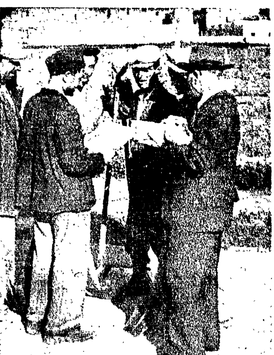
Dopo aver votato, un gruppo di braccianti discute alla periferia di Palermo. Hanno votato per Garibaldi, contro chi da secoli sfrutta il lavoro dei contadini siciliani. Hanno dato al Blocco del Popolo il più forte gruppo parlamentare nell'Assemblea siciliana.