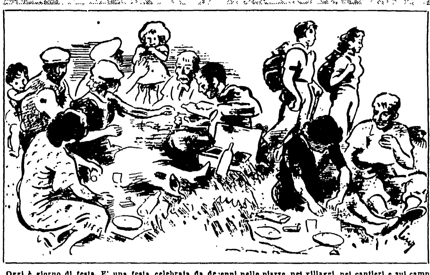
Oggi è giorno di festa. E' una festa celebrata da decenni nelle piazze, nei villaggi, nei cantieri...