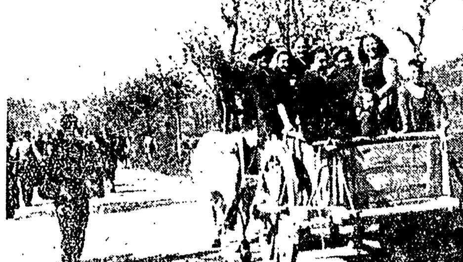
Le strade che conducono a Villa Borghese vedranno oggi passare migliaia di festosi cittadini che a piedi o in improvvvisa giornata di trasporto andranno a passare la giornata in campagna.

Questa mattina tutti al comizio della C. d. L. a Villa Borghese. Alle 10.30, in piazza del Popolo, si svolgerà il comizio di apertura della manifestazione. La manifestazione sarà inaugurata a Villa Borghese alle 11.30, con la premiazione della più bella ragazza della festa. La manifestazione sarà arricchita da gare sportive, orchestre e documentari. Alle 10.30, in piazza del Popolo, si svolgerà il comizio di apertura della manifestazione. La manifestazione sarà inaugurata a Villa Borghese alle 11.30, con la premiazione della più bella ragazza della festa. La manifestazione sarà arricchita da gare sportive, orchestre e documentari.