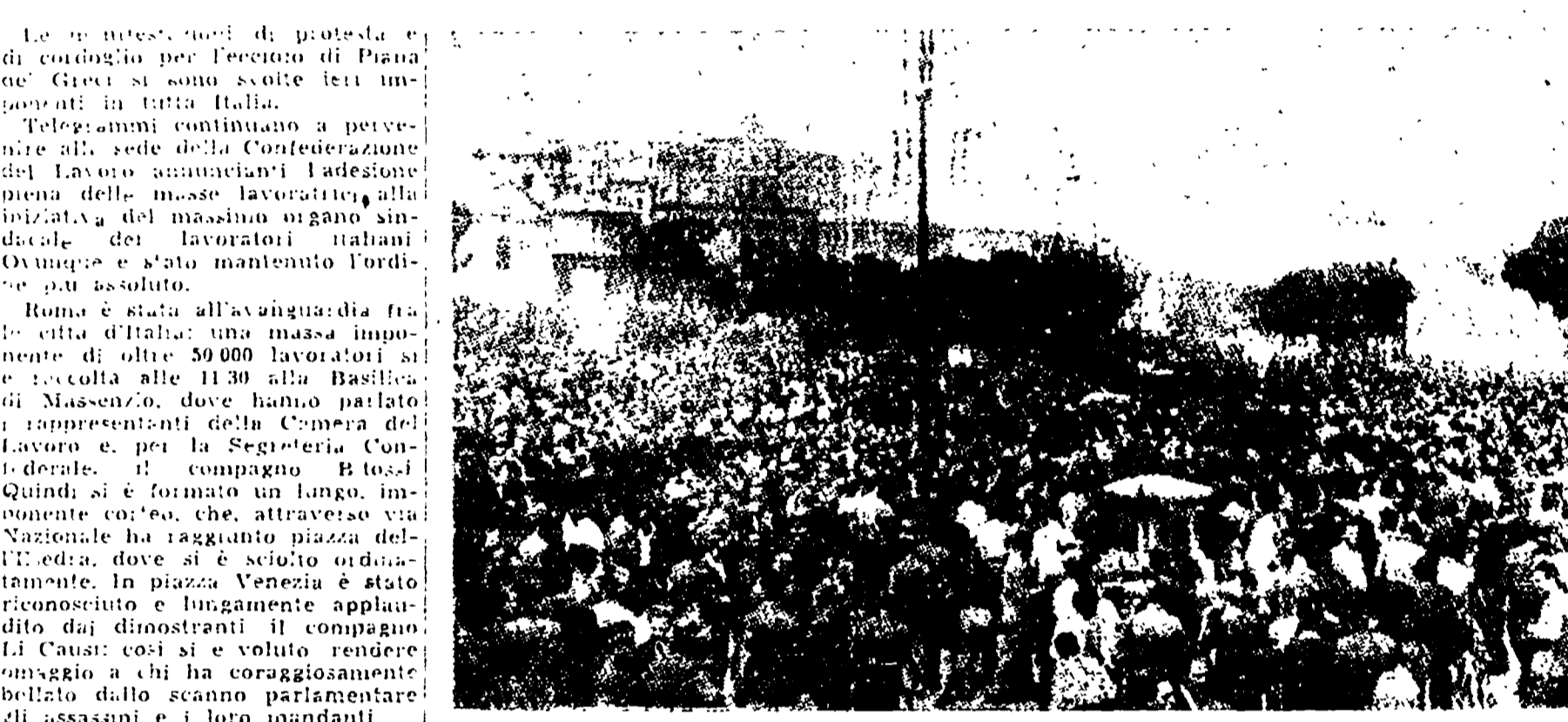
A ROMA: Il corteo dei dimostranti dinanzi alla Basilica di Massenzio

La lotta dei ricchi contro i poveri, è l'intervento straniero. L'ordine della lotta dei ricchi contro i poveri, è l'intervento straniero. L'ordine della lotta dei ricchi contro i poveri, è l'intervento straniero. L'ordine della lotta dei ricchi contro i poveri, è l'intervento straniero.