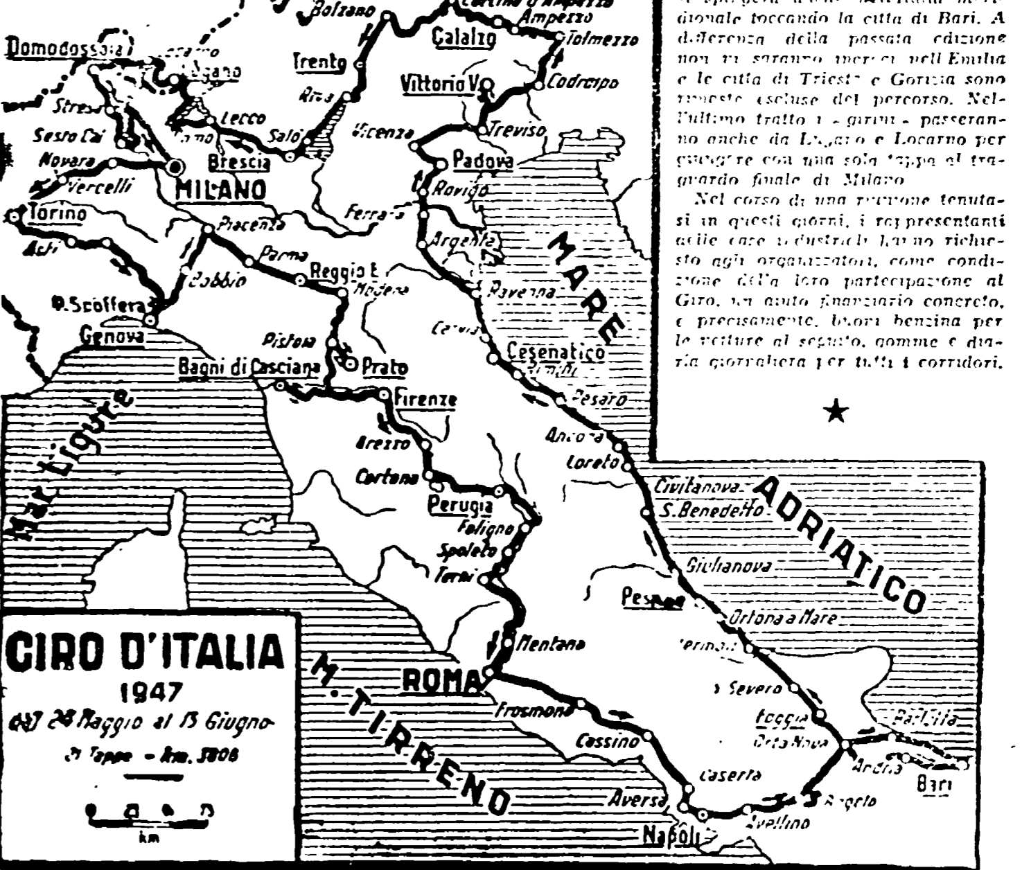
Questo è il Giro d'Italia 1947. Il percorso è stato fissato dal Comitato organizzativo...