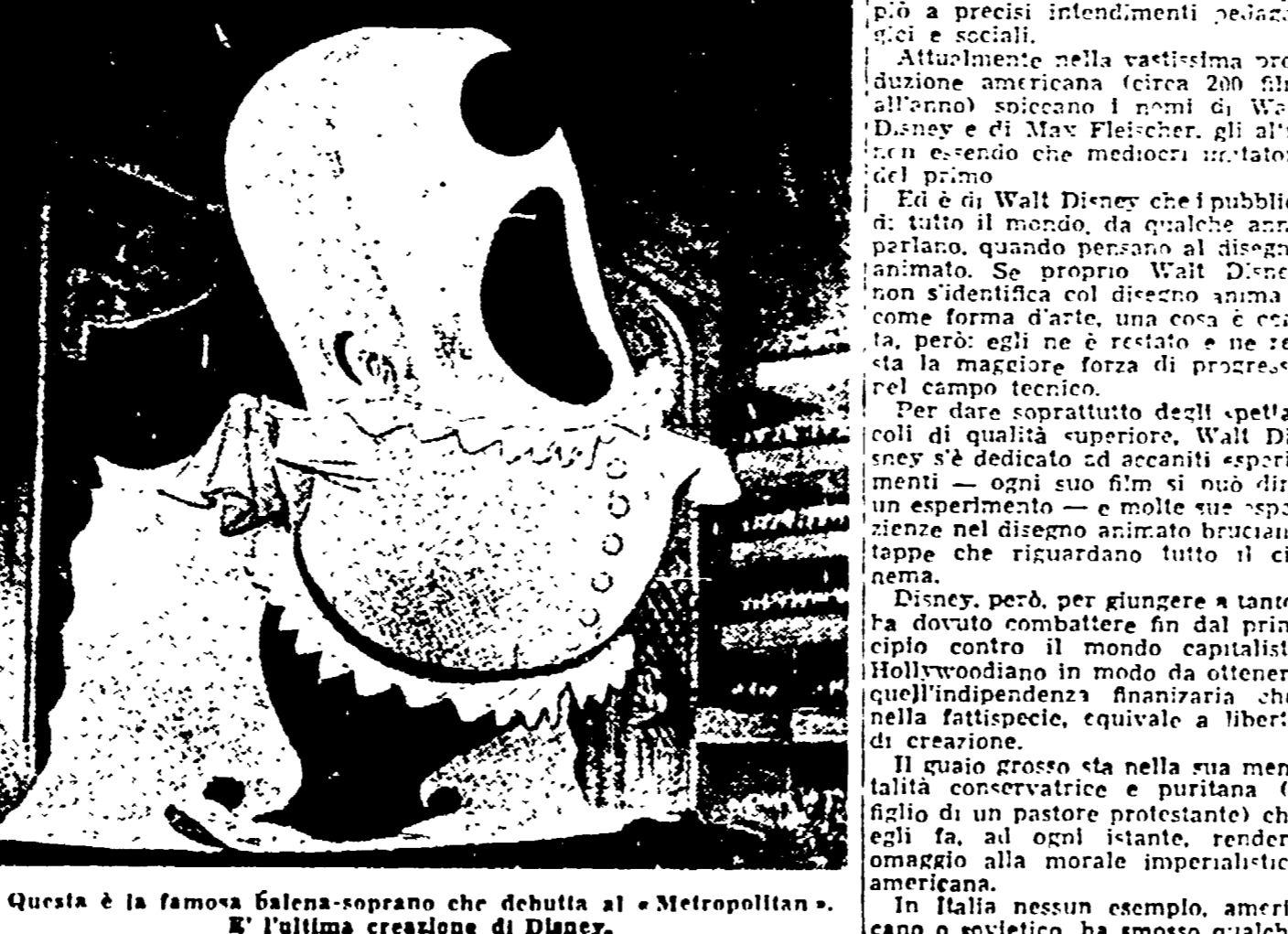
Questa è la famosa balena-sopra che debutta al Metropolitan. E' l'ultima creazione di Disney.