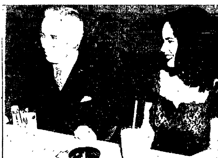
Charlot con sua moglie

Per questa intervista Charlot fu interrogato dalla Commissione per il controllo delle attività anti-americane