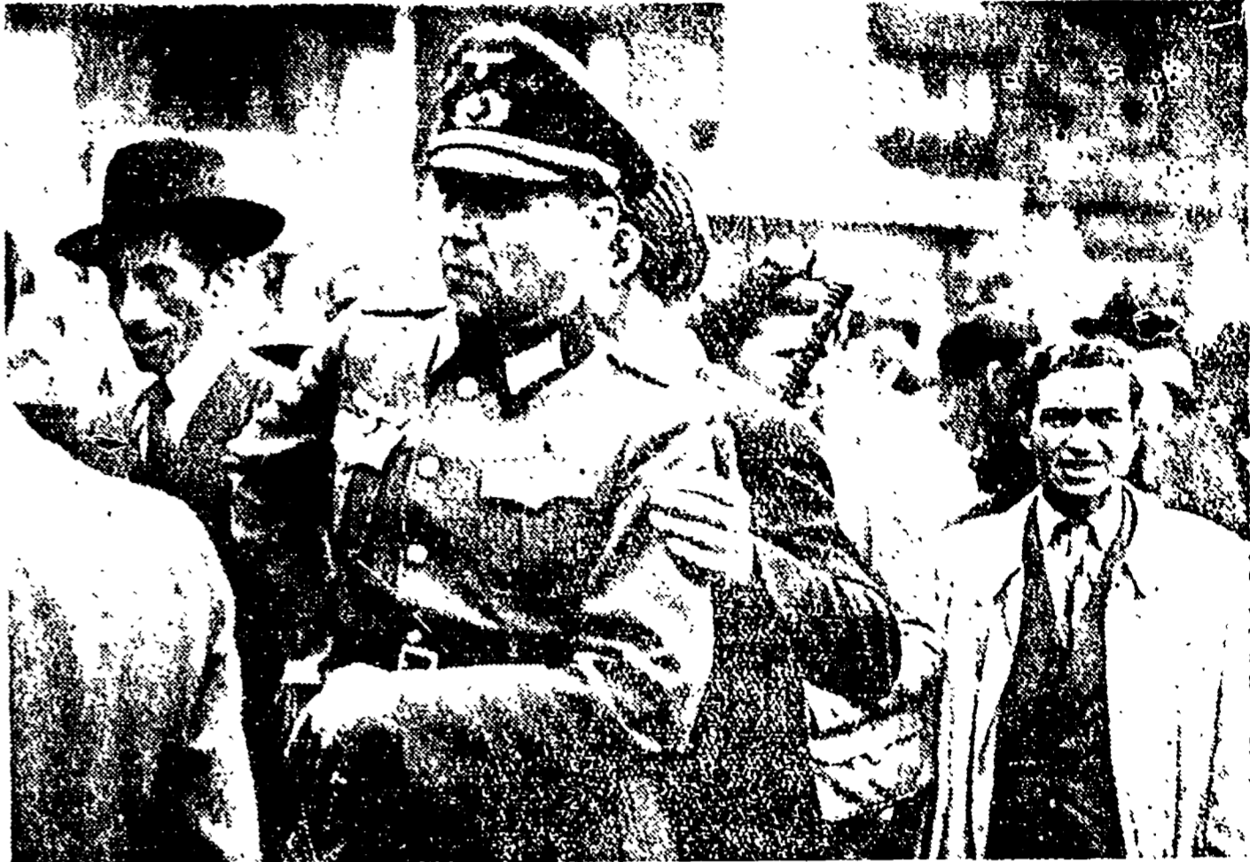
Due anni o sono, 18 maggio, le truppe di Hitler si accendevano alle forze democratiche. Il nazismo era schiacciato. Milioni di uomini erano caduti, milioni di donne e bambini avevano sofferto...