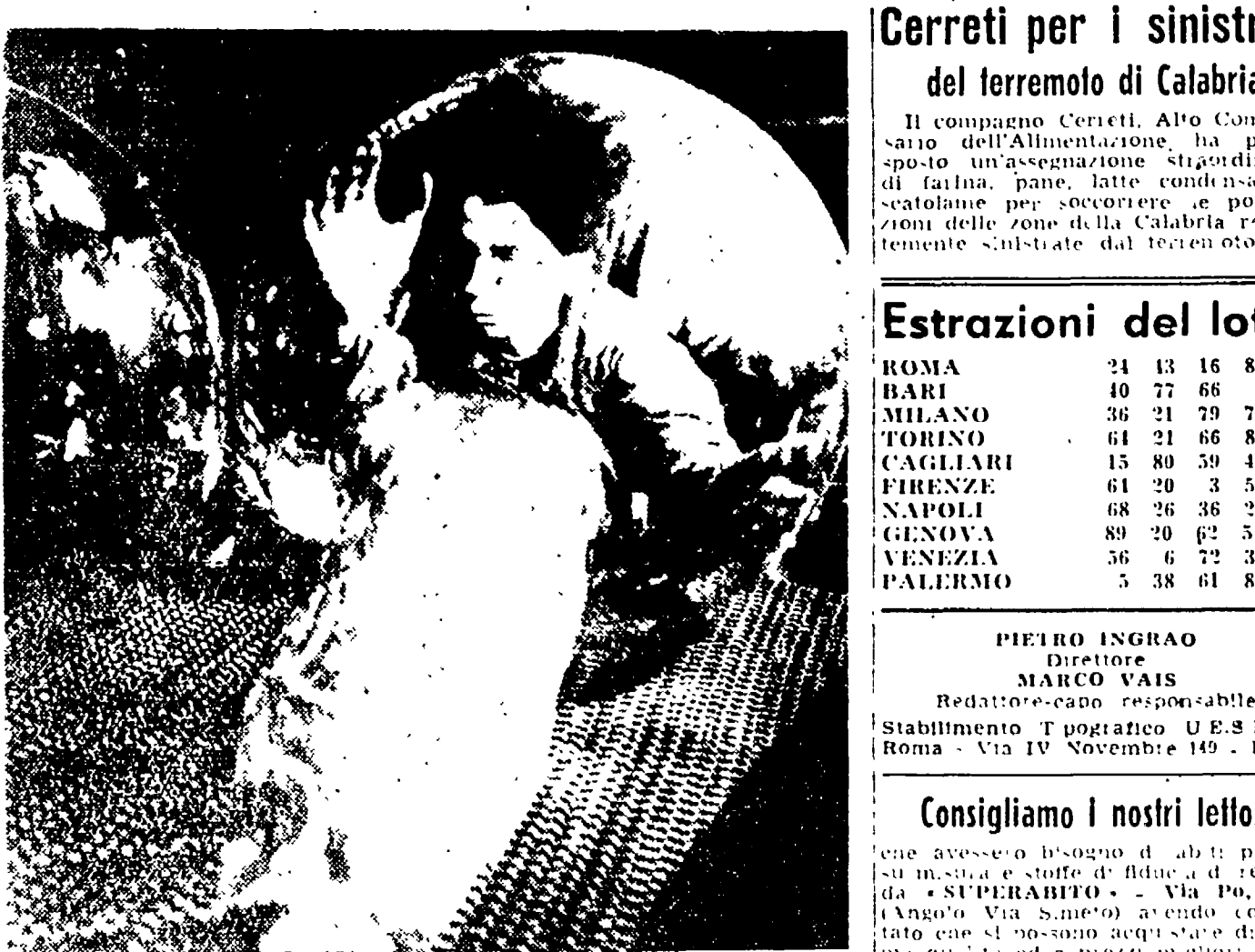
Il Saluto di «L'Unità» ai lavoratori del vetro che hanno tenuto in questi giorni il loro congresso a Empoli... Un gruppo di delegati...