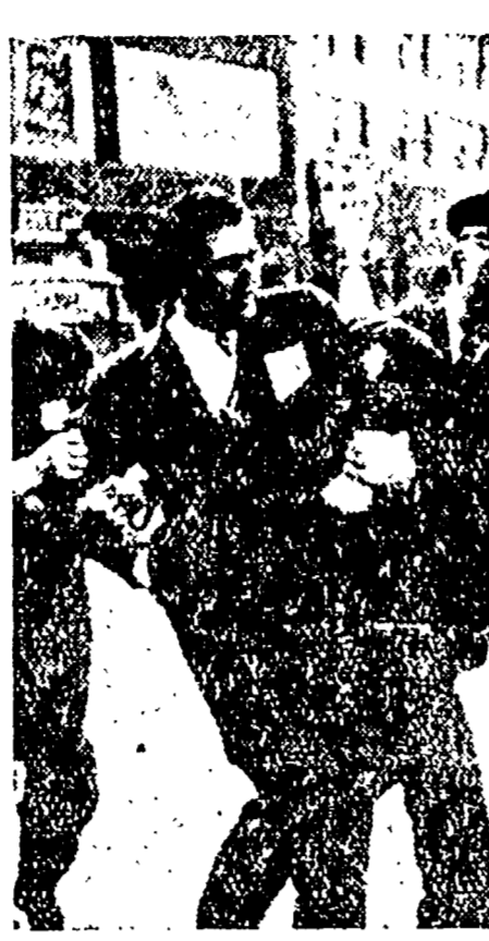
La polizia americana non ha aspettato la firma di Truman alla legge antiscandalo per risolvere il caso di un certo avvocato...

Compiti ideologici. Bisogna dare al giovane una prospettiva nella quale il suo problema di giovane che vuole avere un'istruzione, che vuole avere un'istruzione, che vuole avere un'istruzione, che vuole avere un'istruzione».