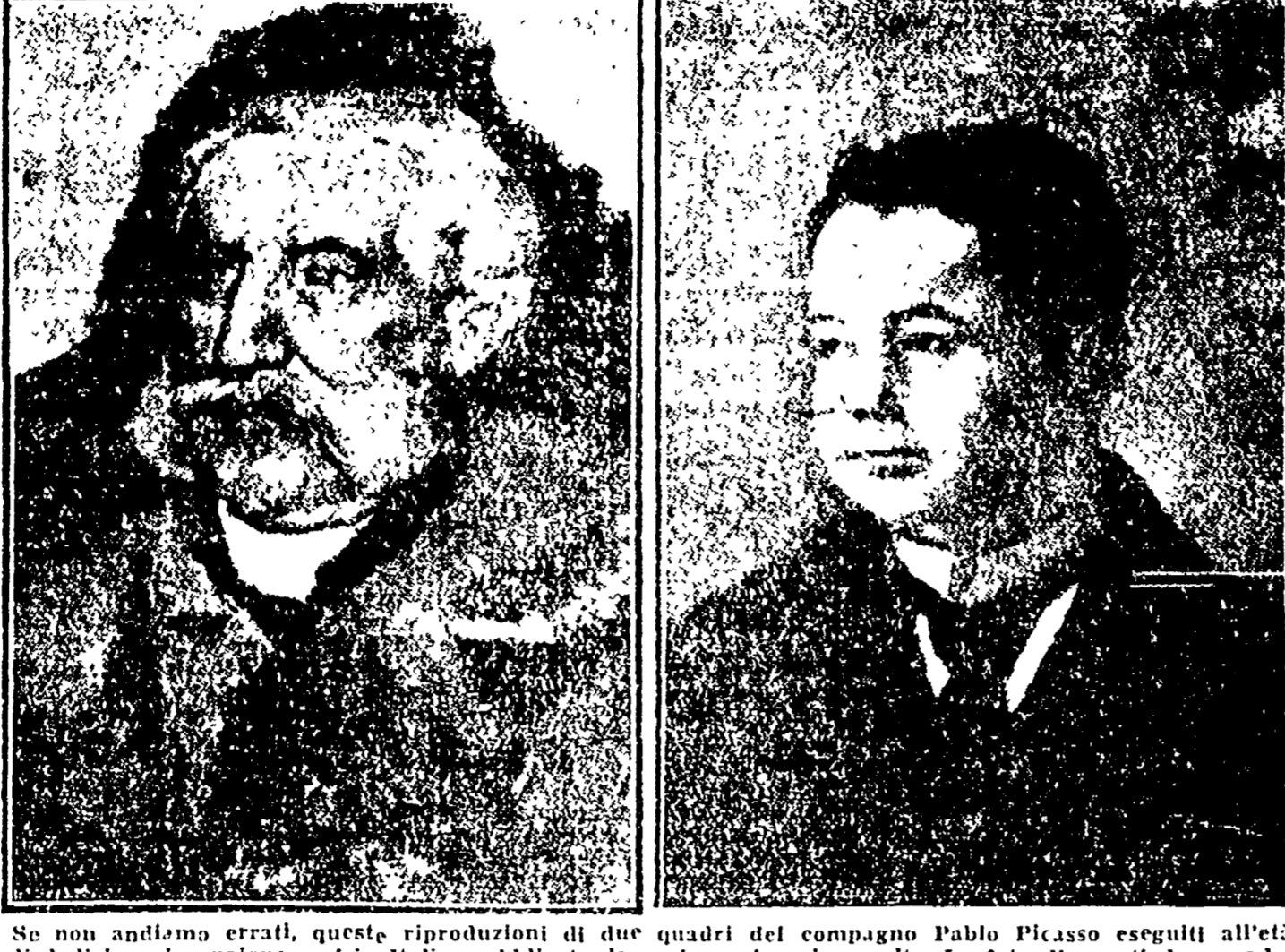
Se non andiamo errati, queste riproduzioni di due quadri del compagno Pablo Picasso eseguiti all'età di dodici anni appaiono, qui in Italia, pubblicate da noi per la prima volta. Le foto di questi due quadri furono donate l'anno scorso da Picasso ad una rivista d'arte francese.