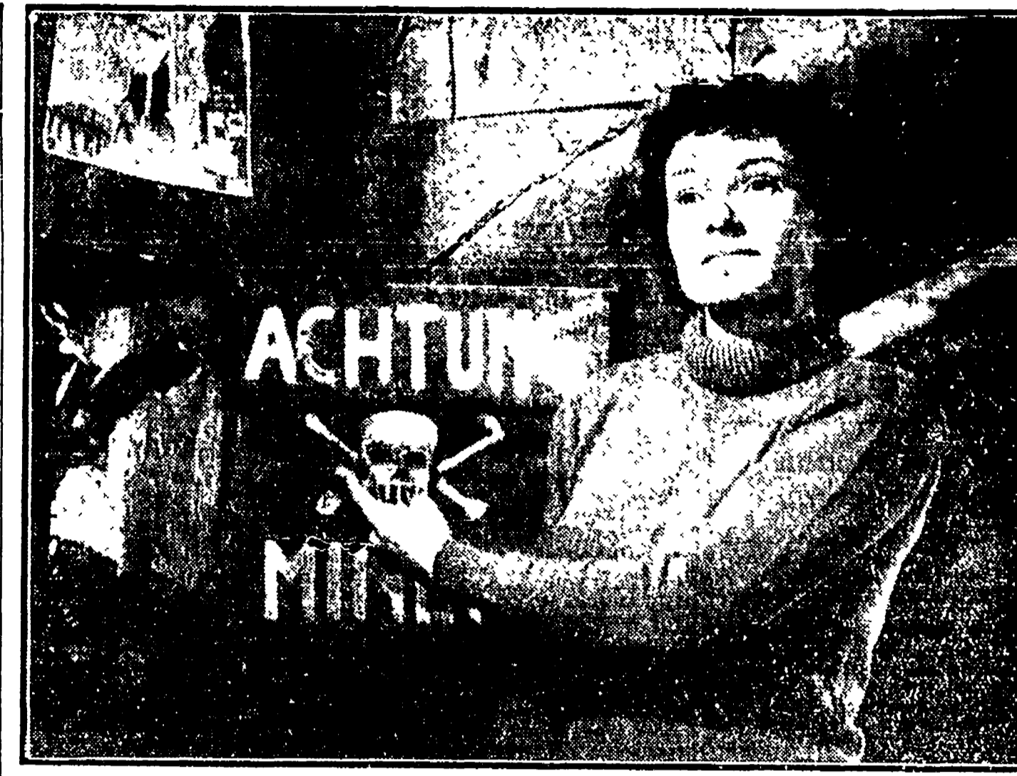
L'attrice Vini Giol in una scena emozionante del film 'Caccia tragica' da poco ultimata a Ravenna...