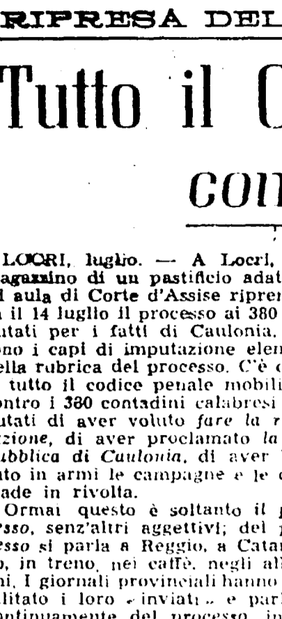
Laconia, luglio. — A Locri, nel MAGLIFI, dopo un pasticcio adattamento ad aula di Corte d'Assise riprendeva il 14 luglio il processo ai 380 imputati per il fatto di Caulonia.

Una vecchia tradizione. «Tour de France» quella di raduno, nelle varie città, giovani italiani per celebrare il lavoro, perché facciano dono di un coro democratico antifascista di tutto il mondo il contributo italiano