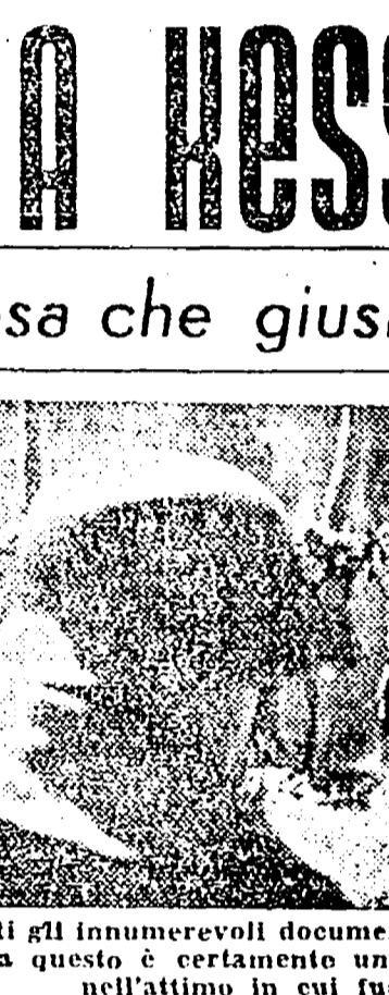
Fra tutti gli innumerevoli documenti sulla atrocità tedesche commesse in Italia questo è certamente uno dei più palpabili: sono tedeschi a nell'attimo in cui fu ucciso un patriota italiano.

Ma questa volta, come cento volte altre volte, non si trattò di una stella: si trattava di un soldato tedesco ucciso. Ucciso perché l'esplosione dei montanari era già in atto.