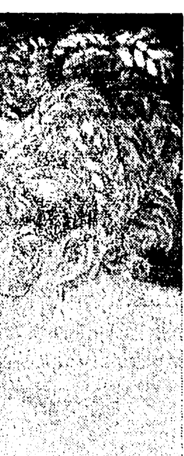
Sono due particolari del quadro di Jacopo Tintoretto «Susanna e i vecchioli» che si trova al Kunsthistorisches Museum di Vienna

Questo è il carro costruito dal Fronte della Gioventù di Taranto. Questo è il carro costruito dal Fronte della Gioventù di Taranto