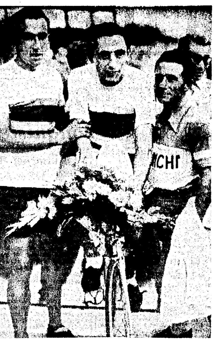
Foto i campioni del mondo d'insegnamento su pista: Leo Benvenuti (per i dilettanti) e Fausto Coppi (per i professionisti). Lo sguardo meravigliato, quasi impaurito, di Benvenuti, un operaio bolognese sconosciuto da tutti sino a pochi giorni prima, sembra voglia esprimere un pensiero: «No, questa proprio non me l'aspettavo!». E, per farsi coraggio e per reprimere l'emozione, il ragazzo «grappa» a Fausto Coppi

«Noi speriamo di raggiungerli quest'anno». Poi Caterina si era messa a parlare di Sergeevna e di Justina, due loro compagne delle delusioni, i due figli del trionfo finale. Ne aveva parlato come di figure storiche, di personaggi di una canzone di questa.