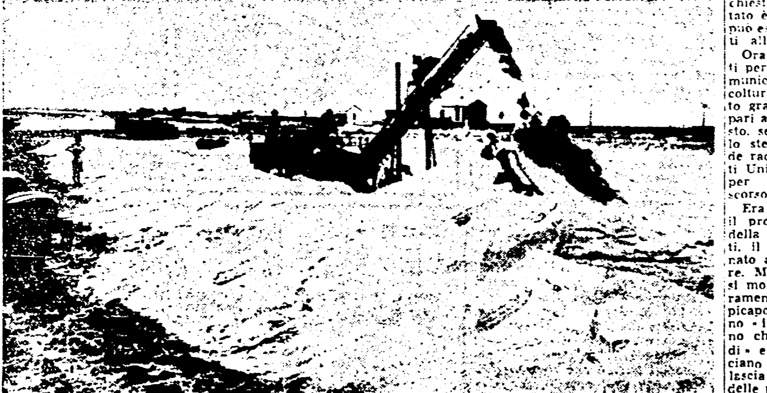
Quando sul proprio tavolo vi sono «sfilanti» neri come la pece e pesanti come il piombo, guardare questa foto equivale a fare un bagno. Pensate: sono mucchi, vere colline di grano americano, che, dato il grande raccolto di quest'anno, non ce l'ha fatta ad entrare nei silos ed è restato all'aria aperta