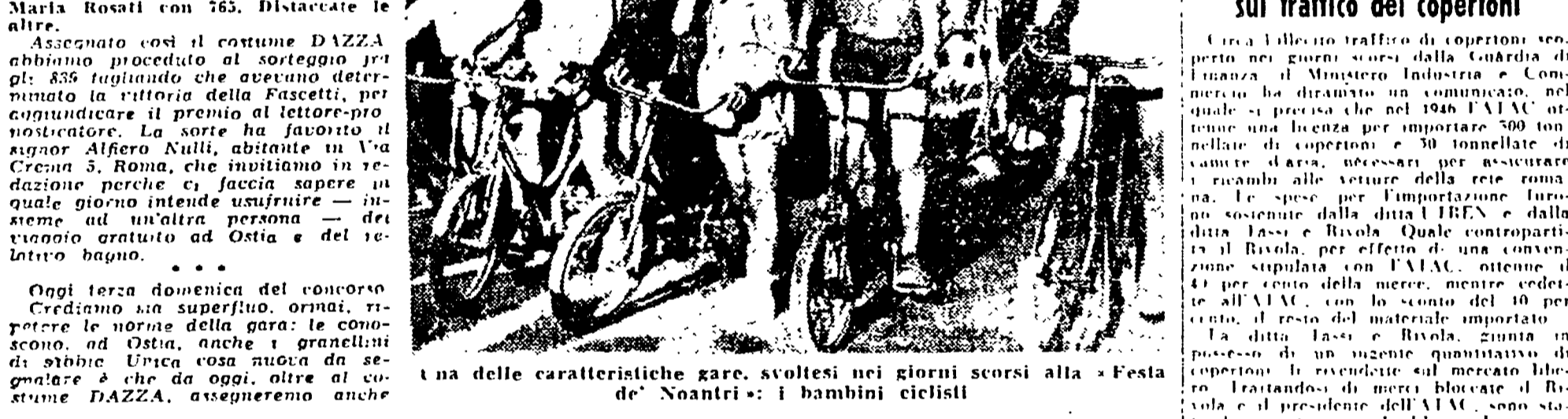
Una delle caratteristiche gare, svoltesi nei giorni scorsi alla Festa de' Noantri: i bambini ciclisti