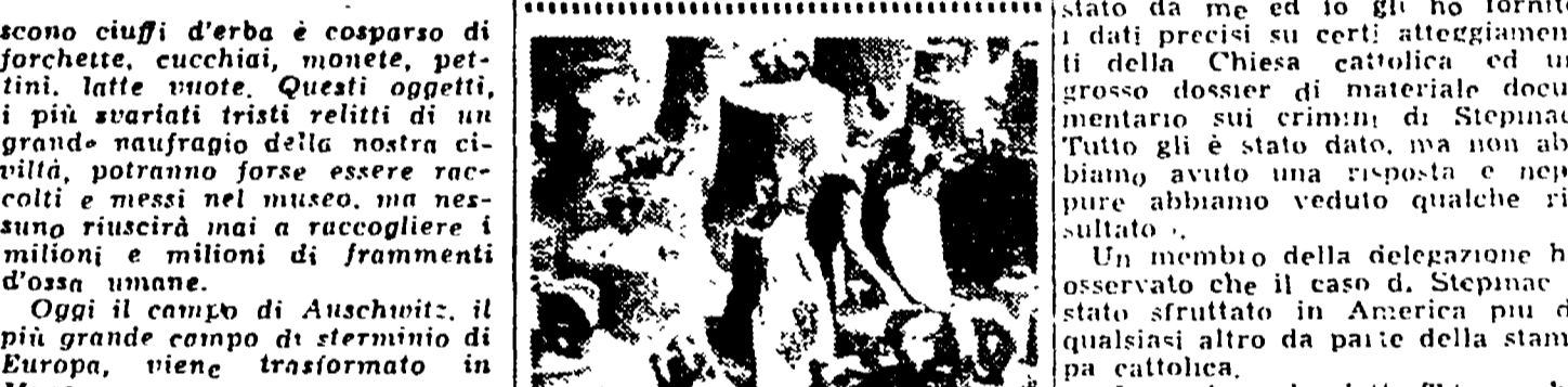
Il Museo della "civiltà nazista" Gli americani in muratura delle S.S. stanno mutando in tanti padiglioni, in ognuno dei quali vengono raccolti tutti gli oggetti appartenenti alle vittime delle diverse nazioni...