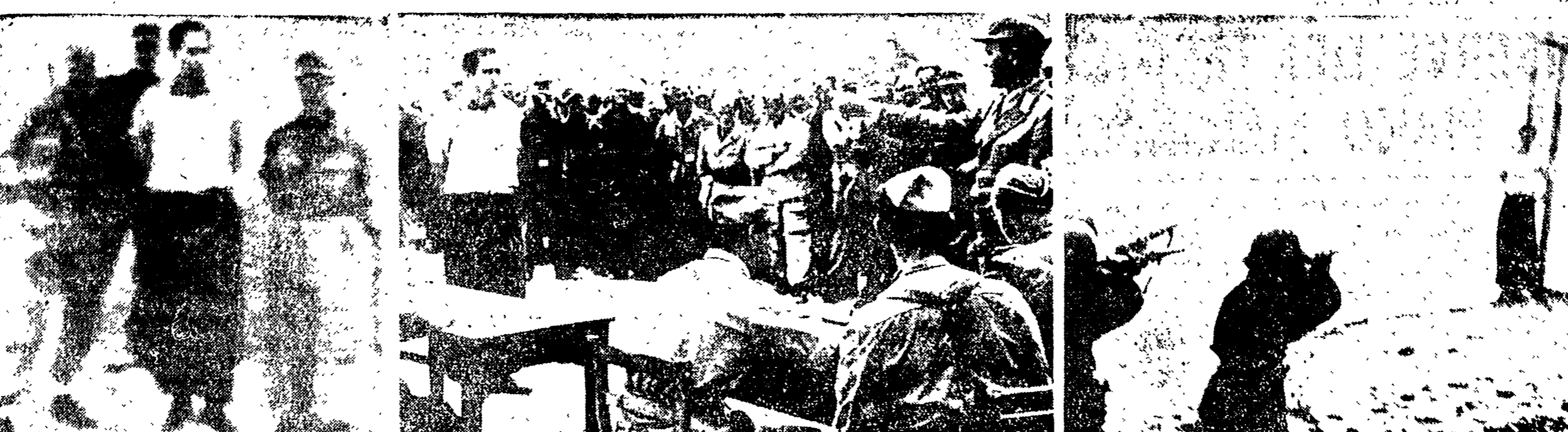
Oggi, 7 settembre, in tutta Italia si ricorda la costituzione delle eroiche Brigate Garibaldi le quali, nei giorni tristi attraversati dal nostro Paese, nel nome dell'eroe del secolo, seppero mettersi al servizio della Patria. In questo giorno tanto significativo, noi sentiamo il dovere di ricordare i nostri caduti. Ecco tre rare fotografie nelle quali si può vedere l'arresto, la condanna e la fucilazione di un patriota italiano da parte delle S.S. tedesche.

Ma è evidente che nella situazione e nel momento in cui questa giornata garibaldina ha luogo, essa acquista anche un significato politico. In particolare, essa significa che nella indifferenza generale degli organi ufficiali dello Stato italiano per i combattenti e stato guerra di liberazione nazionale, e per i migliori loro amici delle altre formazioni partigiane, si assumono il compito, che è anche un dovere nazionale, di non lasciare morire le tradizioni partigiane, che furono tradizioni di unità popolare, di amore di sacrificio e di amor di patria.