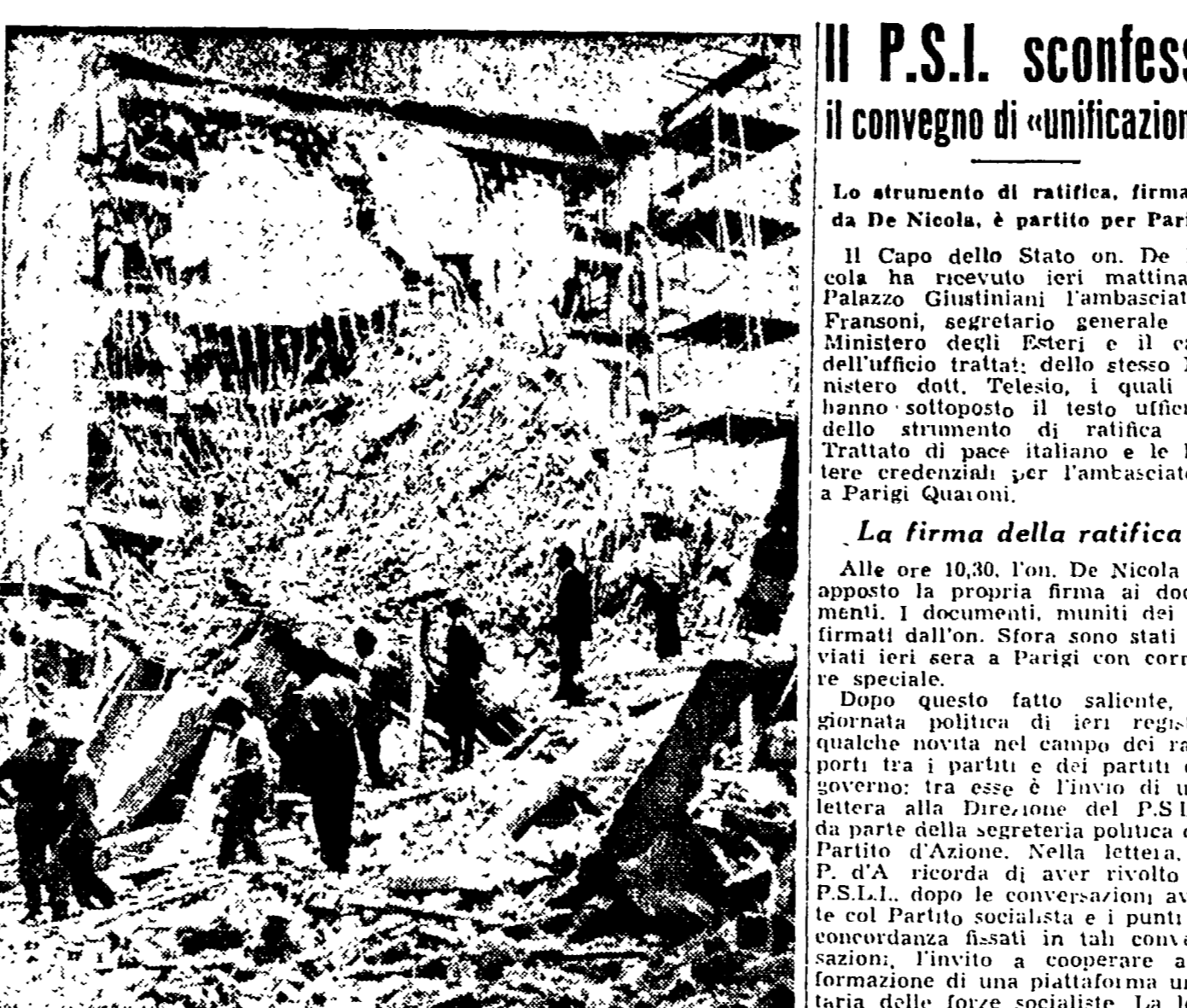
Ecco una tragica visione del palazzo della Rinascenza crollato ieri l'altro a Milano. I lavori per tentare di salvare le persone rimaste sottoposte...

Il Consiglio Economico Nazionale ha tenuto di sera i lavori chiudendo la discussione sul tema: «La posizione dell'economia italiana in relazione al piano Marshall».