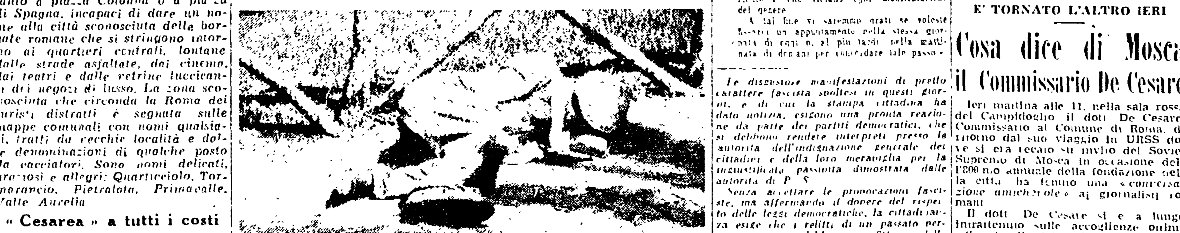
Anche dal tetto della sua « casa » è visibile il cielo stellato.