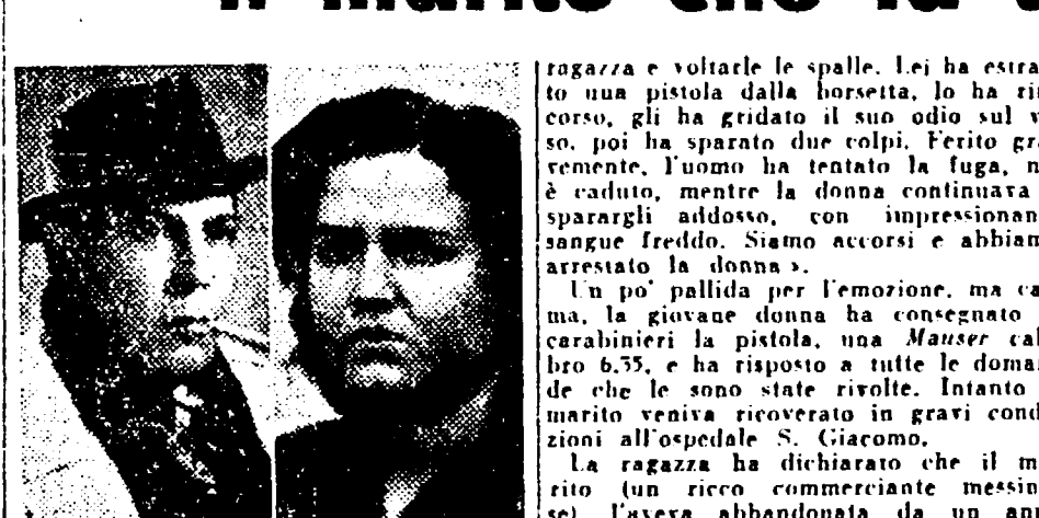
La ragazza che ha ucciso il marito che la tradisce

Viene da Messina per uccidere il marito che la tradisce