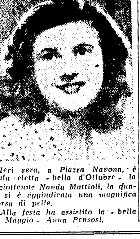
Ieri sera, a Piazza Navona, la bella d'Ottofre...