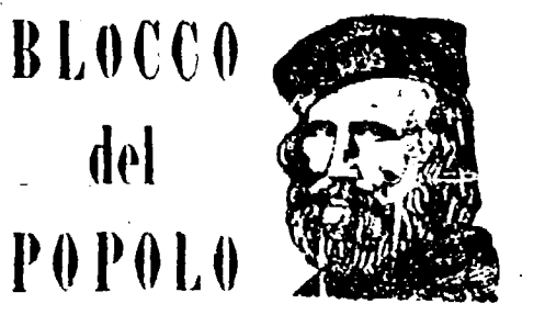
BLOCCO del POPOLO