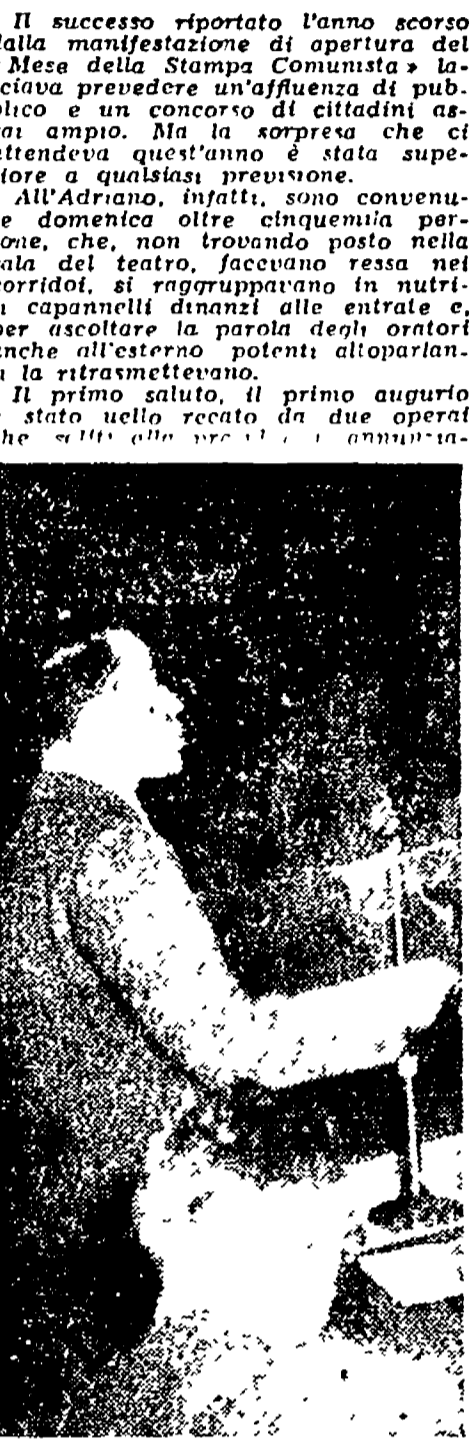
Il nostro direttore illustra ad oltre cinquemila persone la battaglia della stampa democratica - Indimenticabile gara di generosità - Fe te a Testaccio, Colonna e Valle Aurelia