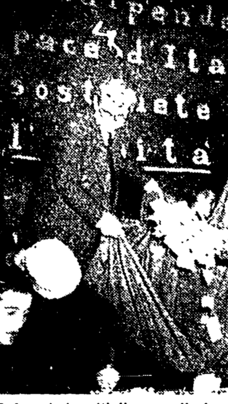
I denari si moltiplicano nella bandiera rossa. Il popolo romano testimonia il suo affetto e la sua solidarietà per il giornale dei lavoratori.

Il popolo vuol bene ai vecchi dirigenti d'orchestra che d'inchiostro pubblico con la sua galdrappa di capostazione. Domenica mattina il sipario dell'Adriano