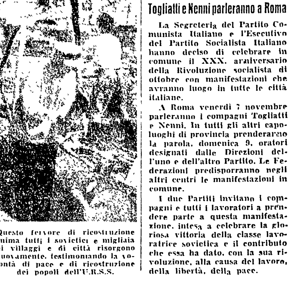
Togliatti e Nenni parleranno a Roma

P.C.I. e P.S.I. hanno deciso di celebrare in comune la ricorrenza in tutte le città italiane