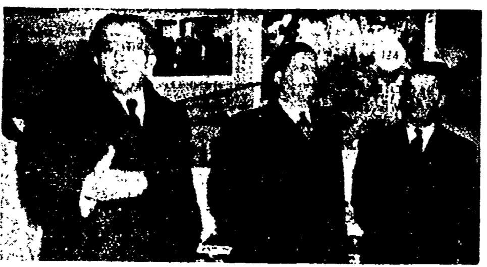
Sotto gli auspici dell'Associazione per i rapporti culturali con l'U.R.S.S. ieri si è aperta la Mostra celebrativa del Trentadecimo anniversario della Rivoluzione d'Ottobre...