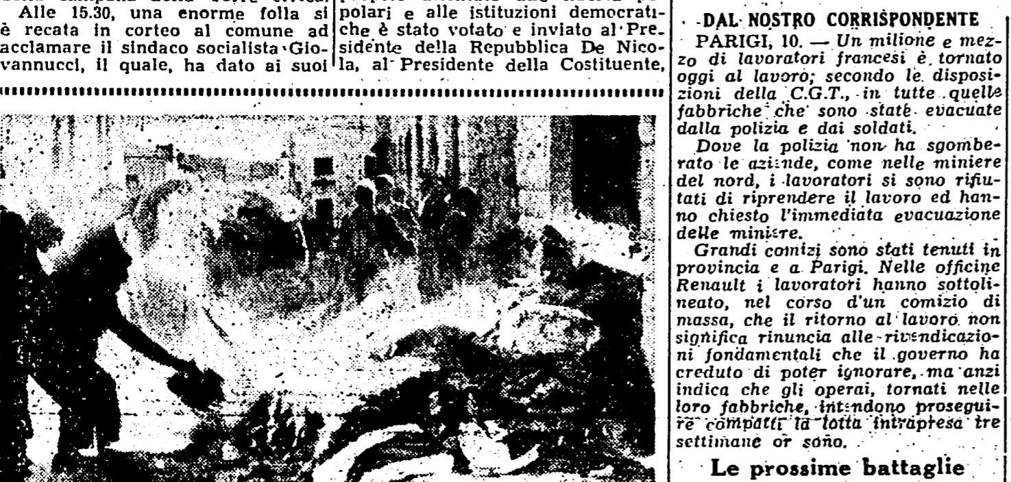
Novi arabi e tre ebrei sono le ultime vittime degli incidenti verificatisi tra gli ebrei e gli arabi. Intanto a Gerusalemme le case degli ebrei e degli arabi continuano ad essere saccheggiate ed è frequente vedere nelle strade i roghi formati dalle masserizie gettate dalla folla.

La Torre civica ha suonato a raccolta. Il prefetto ha chiamato stamane il sindaco in Prefettura, ma quest'ultimo si è rifiutato di muoversi dal palazzo comunale dove siede in permanenza insieme ai consiglieri comunali, socialisti e repubblicani.