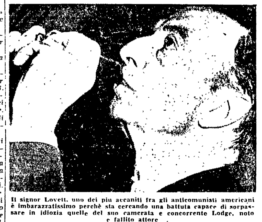
Il signor Lovett, uno dei più accaniti fra gli anticomunisti americani è imbarazzatissimo perché sta cercando una battuta capace di sorpassare in idiozia quelle del suo camerata e concorrente Lodge, noto e fallito attore.