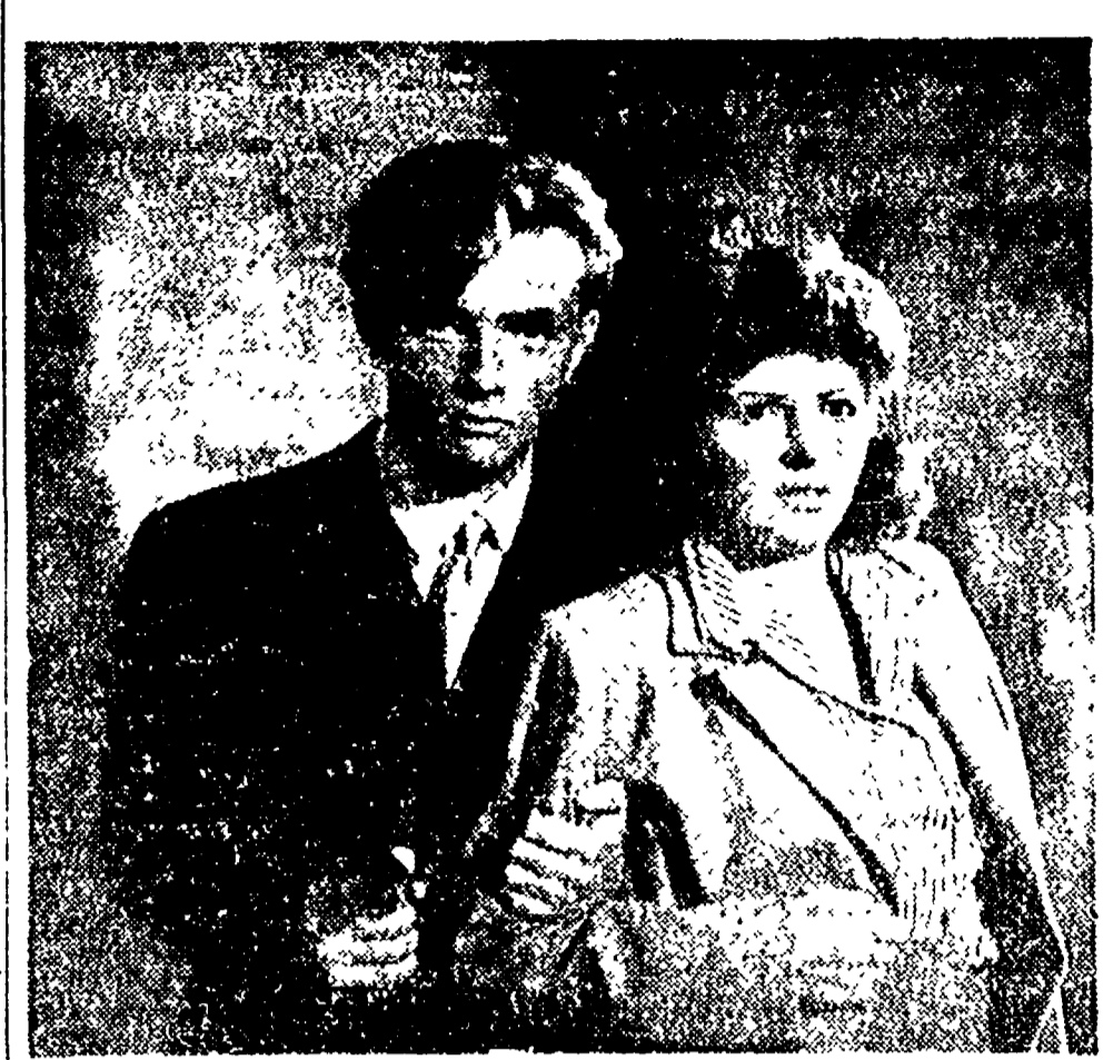
Il film « Gioventù Perduta » di Germi, è stato rigidamente censurato dal governo democristiano...