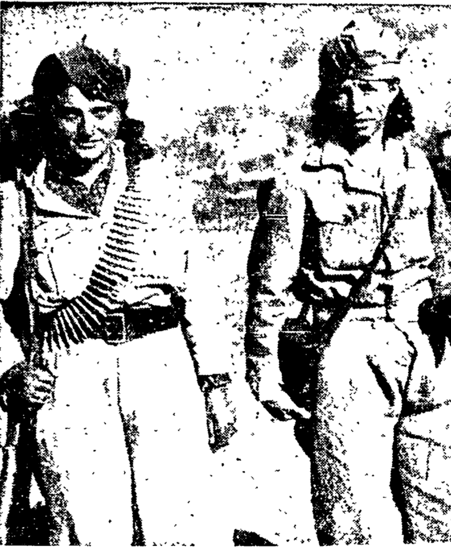
In Grecia anche le donne partigiane, con le truppe partigiane del nuovo governo democratico greco, alla lotta di liberazione contro i fascisti di re Paolo.