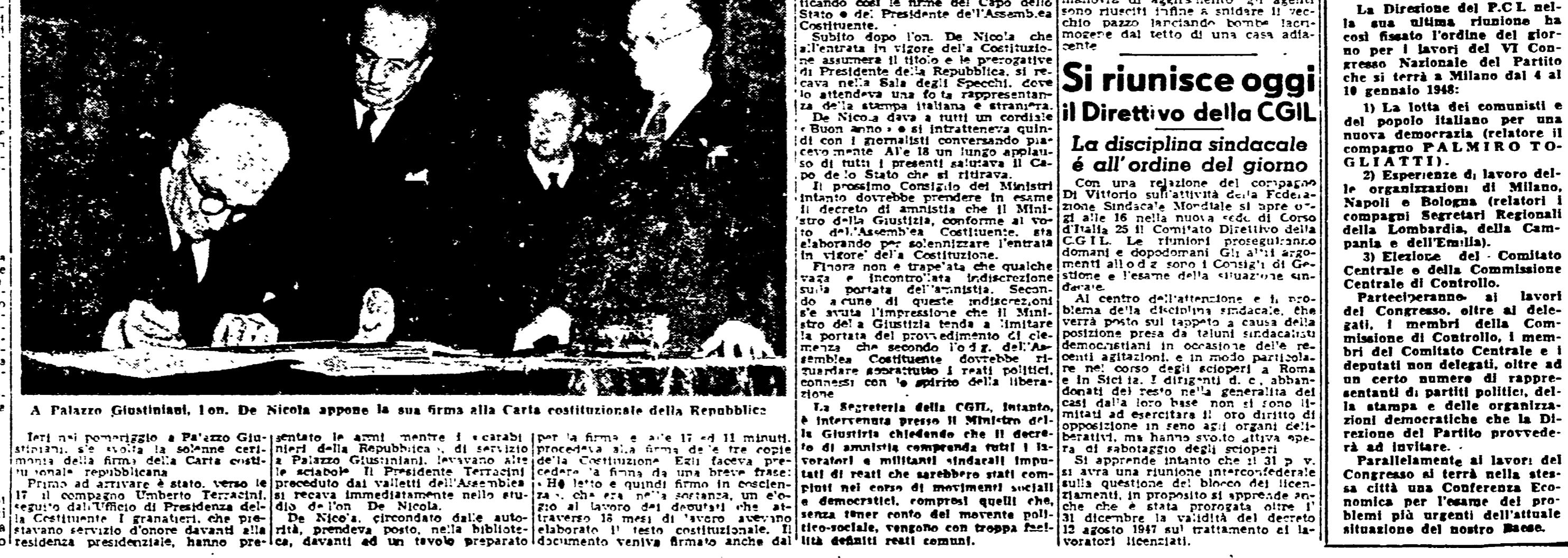
A Palazzo Giustiniani, l'on. De Nicola appone la sua firma alla Carta costituzionale della Repubblica.

Il Capo dello Stato e il Presidente dell'Assemblea hanno apposto le firme sulla Carta Costituzionale - L'amnistia al prossimo Consiglio dei Ministri