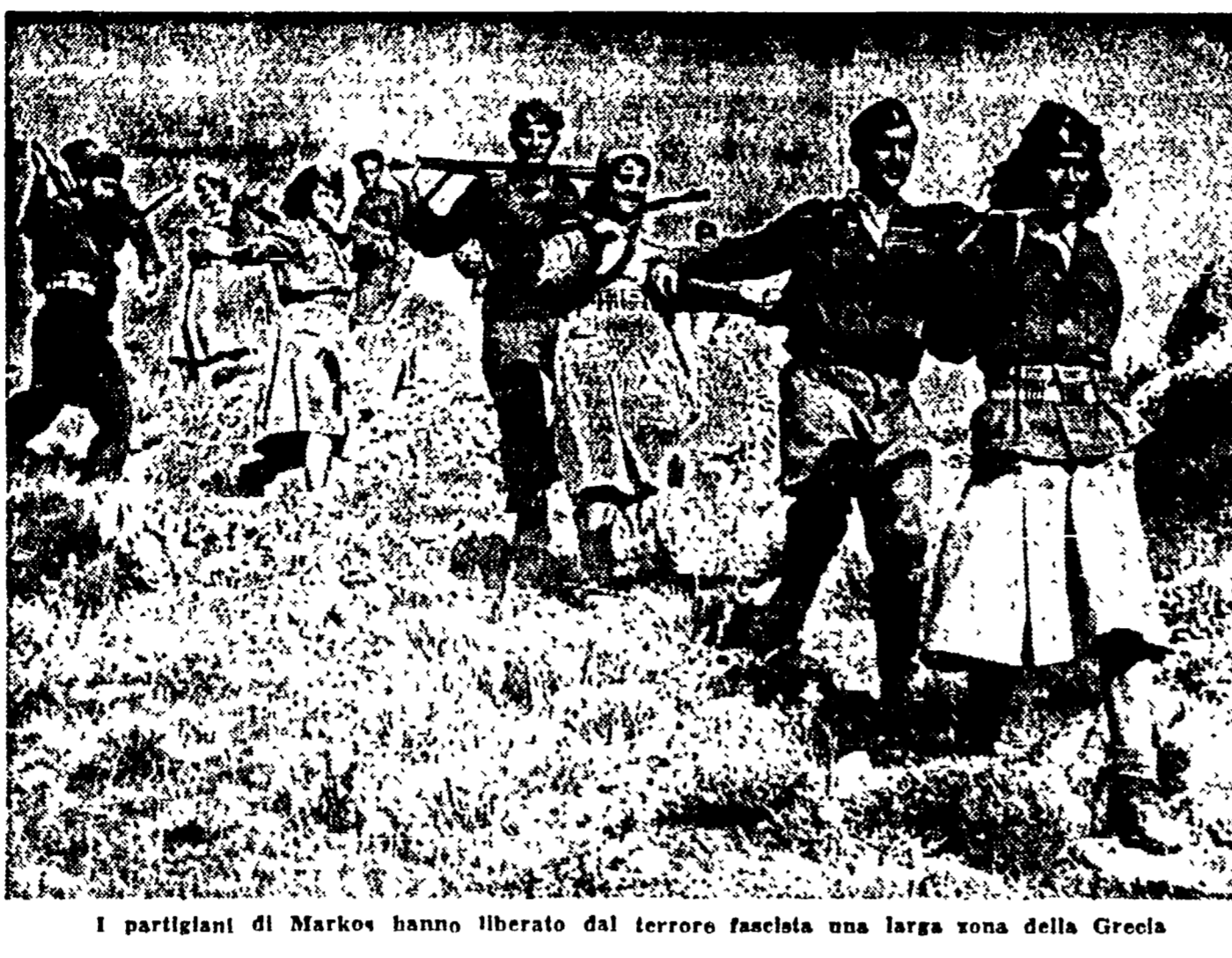
I partigiani di Markos hanno liberato dal terrore fascista una larga zona della Grecia