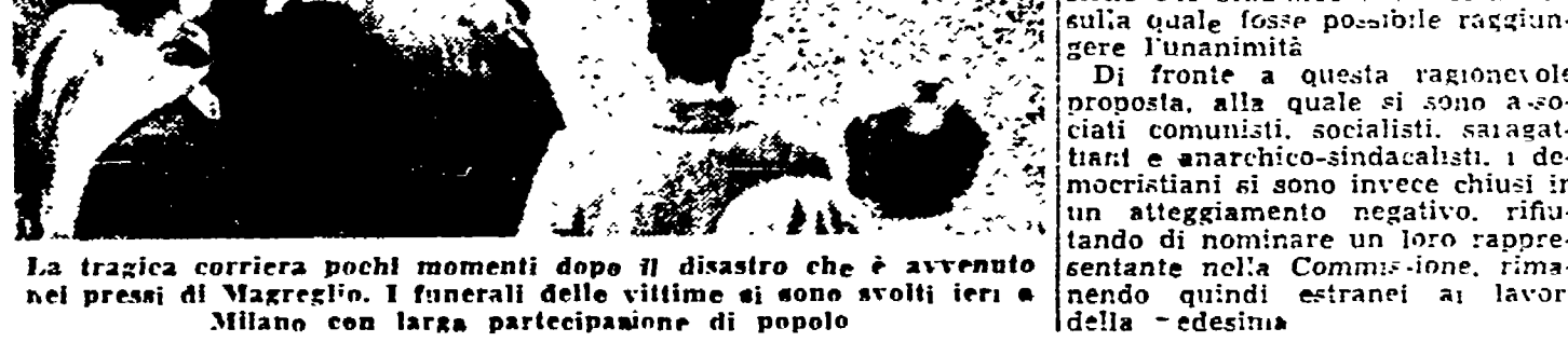
La tragica corriera pochi momenti dopo il disastro che è avvenuto nei pressi di Segrate. I funerali delle vittime si sono svolti ieri a Milano con larga partecipazione di popolo.

Wallace ha proposto il disarmo atomico e la sicurezza per i giovani. Wallace ha proposto il disarmo atomico e la sicurezza per i giovani. Wallace ha proposto il disarmo atomico e la sicurezza per i giovani.