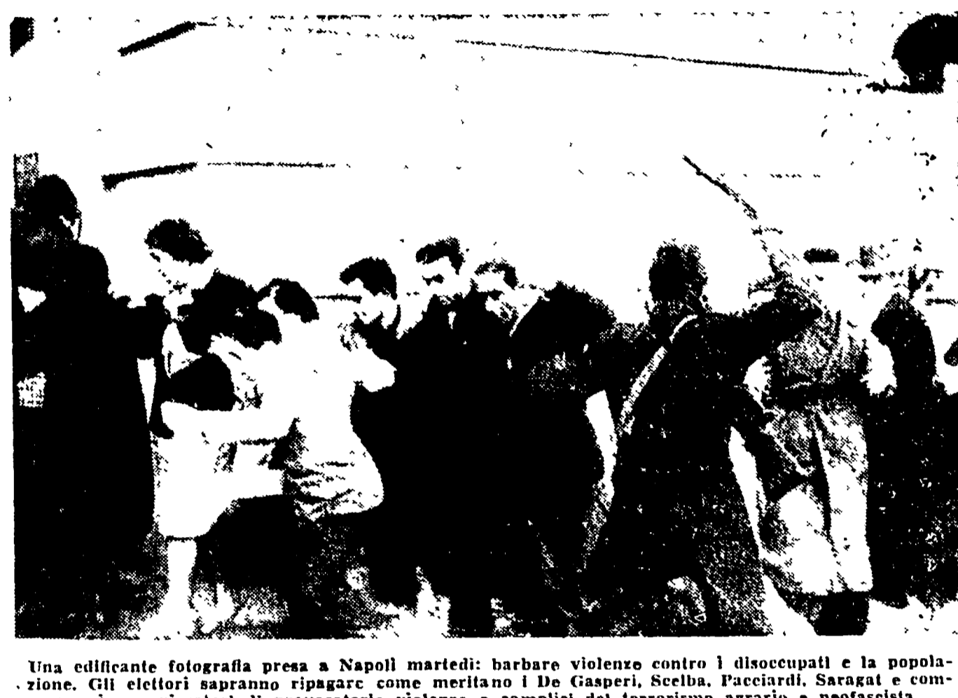
Una edificante fotografia presa a Napoli martedì: barbute violente contro i disoccupati e la popolazione. Gli elettori appaiono ripagare come meritano i De Gasperi, Scelba, Pacciardi, Saragat e compagni, organizzatori di provocatorie violenze e complici del terrorismo agrario e neofascista