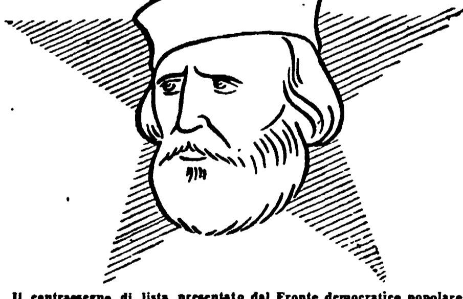
Il contrassegno di lista presentato dal Fronte democratico popolare

Durante l'anno 1947, le organizzazioni sindacali hanno svolto una azione importante in difesa della maternità. E' del gennaio dello scorso anno, infatti, la conclusione del primo contratto collettivo nazionale per gli operai tessili che stabilisce il congedo di maternità in tre mesi prima e sei settimane dopo il parto, pagato non più al 66% del salario percepito, ma bensì al 75%. Questa vittoria delle operai tessili è stata preceduta da quella delle operaie chimiche ed in seguito da quelle di altri settori industriali. Ma l'azione sindacale di tutela della maternità non poteva, come è ovvio, limitarsi alle operai. Pare le impiegate sono lavoratrici e devono essere difese come lavoratrici e come madri. Ecco perché, per esempio, nel contratto di lavoro dei tessili già citato, veniva stabilito che l'impiegata gestante aveva diritto ad un congedo, pagato interamente, di quattro mesi complessivi, oltre ad un congedo facoltativo di altri quattro mesi pagati al 50 per cento. Questa azione delle organizzazioni sindacali si era anche basata sul progetto della Costituzione della Repubblica, in seguito approvato dall'Assemblea Costituente, dove è detto che «l'impiegata ha diritto di essere difesa come lavoratrice e come madre». L'impiegata ha diritto di essere difesa come lavoratrice e come madre. L'impiegata ha diritto di essere difesa come lavoratrice e come madre.