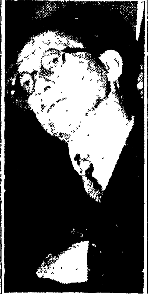
Pescara è una bella città. Ma perché passare tanto? (Dal discorso di De Gasperi alla Basilica di Massenzio).

Non vi è bisogno di troppe parole per sottolineare il significato della smagliante vittoria, che il popolo di Pescara, raccolto sotto la bandiera del Fronte, ha riproposto domenica nelle elezioni amministrative. A Pescara il partito della Democrazia Cristiana — per la prima volta in una grande città — ha tentato di realizzare una losca operazione di quindici dall'alto, e con il pretesto bugiardo di irregolarità burocratiche, la amministrazione democratica, eletta dai pescaresi nell'aprile 1946. L'operazione è fallita. Le forze che compongono il perno della amministrazione democristiana, hanno ricevuto domenica, dal suffragio popolare, una triomfale conferma. Meglio ancora: esse hanno raccolto tremila voti in più rispetto al 2 giugno ed hanno guadagnato quattro seggi in più dei diciassette conquistati nelle prime elezioni amministrative. La maggioranza assoluta nel Consiglio Comunale è andata a vantaggio della lista del Fronte.