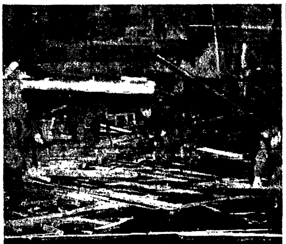
Via Bisolati ostruita dai resti del pauroso crollo

Il Fronte ravviva in questi atti la precisa e costante volontà del Fronte di non tollerare la politica di licenziamenti e di abbattere l'industria a Roma e in provincia. Il Fronte si adopera per la occupazione, intercettare la produzione e la distribuzione di prodotti di licenziamento e di abbattere l'industria di licenziamento. Il Fronte ravviva in questi atti la precisa e costante volontà del Fronte di non tollerare la politica di licenziamenti e di abbattere l'industria a Roma e in provincia. Il Fronte si adopera per la occupazione, intercettare la produzione e la distribuzione di prodotti di licenziamento e di abbattere l'industria di licenziamento.