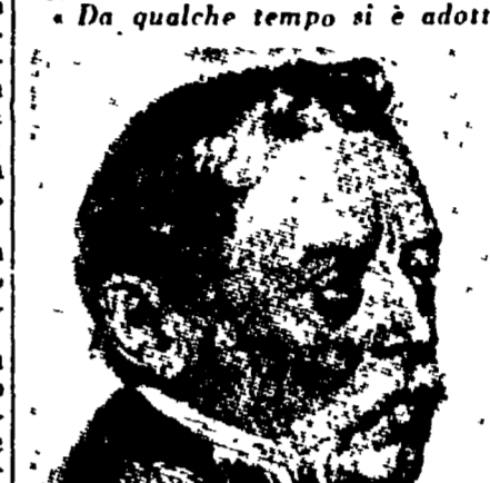
Il teid-maresciallo Radetzky.