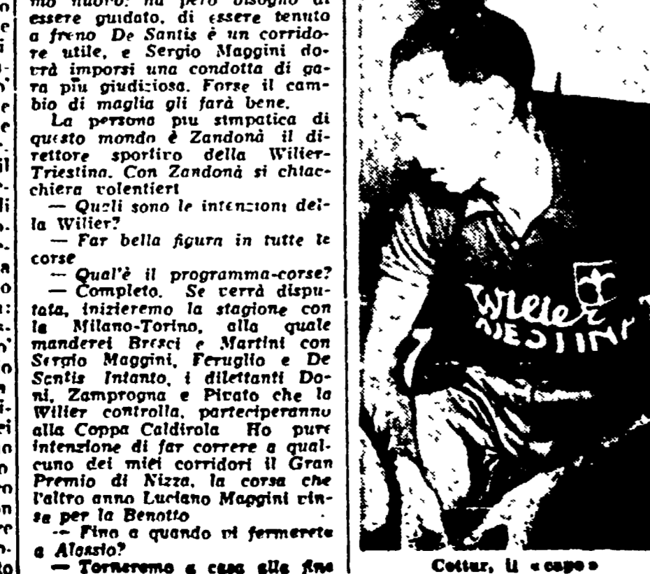
Cottur, il «coppo»