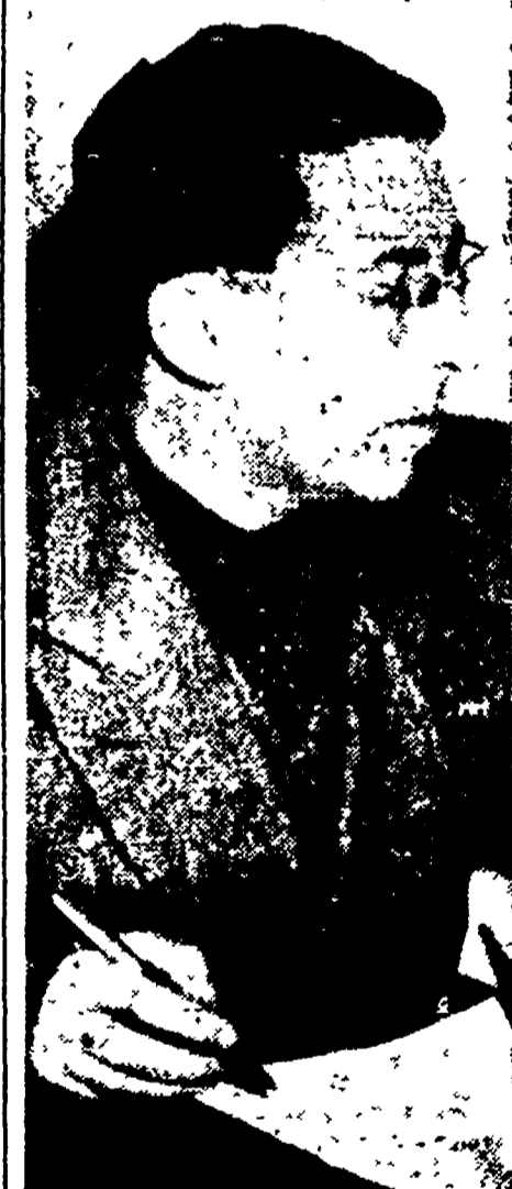
Il compagno Secchia, eletto vice segretario del partito accanto al compagno Longo

La Direzione del P.C.I. comunica: Nel corso della passata settimana si è riunita in Roma la Direzione del Partito comunista italiano. Il compagno Longo ha riferito circa le decisioni degli organi direttivi del Fronte democratico popolare di presentare in tutta Italia liste uniche del Fronte per la Camera e per il Senato. La Direzione ha espresso il proprio compiacimento per questa decisione, che contribuisce al rafforzamento della democrazia italiana e rende più sicura la vittoria delle forze democratiche, e ha elaborato le istruzioni da trasmettere alle organizzazioni periferiche per la scelta dei candidati e il modo di svolgere la campagna elettorale.