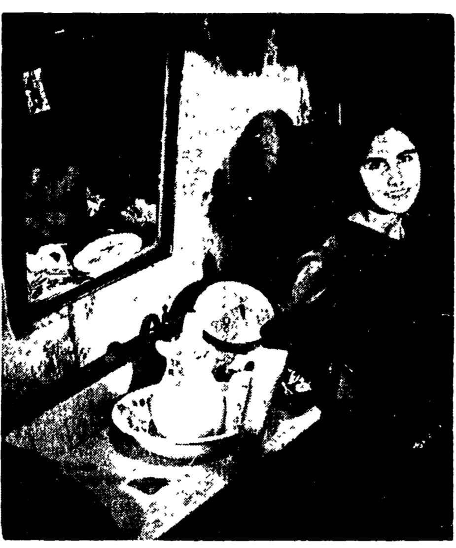
Non è l'interesse pittoresco del paesaggio che ha attirato Luciano Visconti in Sicilia. «La terra tremò» il fine che questo regista di talento sta attualmente realizzando ad Aci Trezza...