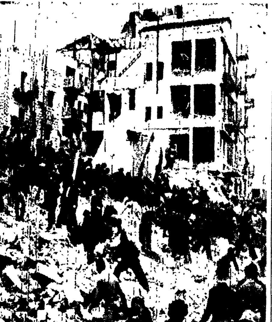
L'Hotel Atlantic dopo la tragica esplosione che ha distrutto una gran parte del centro di Gerusalemme

Arabi ed ebrei dichiarano di non conoscere gli autori dell'attentato - Caccia agli inglesi - Denuncia dell'Agenzia Ebraica