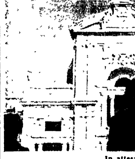
In attesa del miracolo