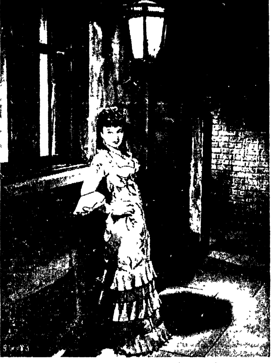
Goozie Withers, una delle più giovani attrici del cinema inglese