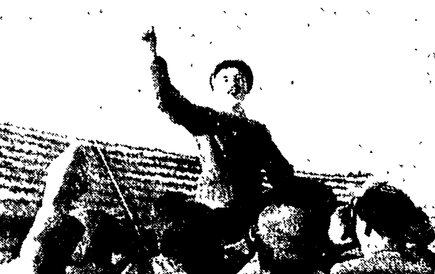
In un villaggio e sorta una nuova cooperativa

In treno verso Sofia - Quanto si spende per vivere? Nè sprechi, nè ingiustizie - La via del socialismo