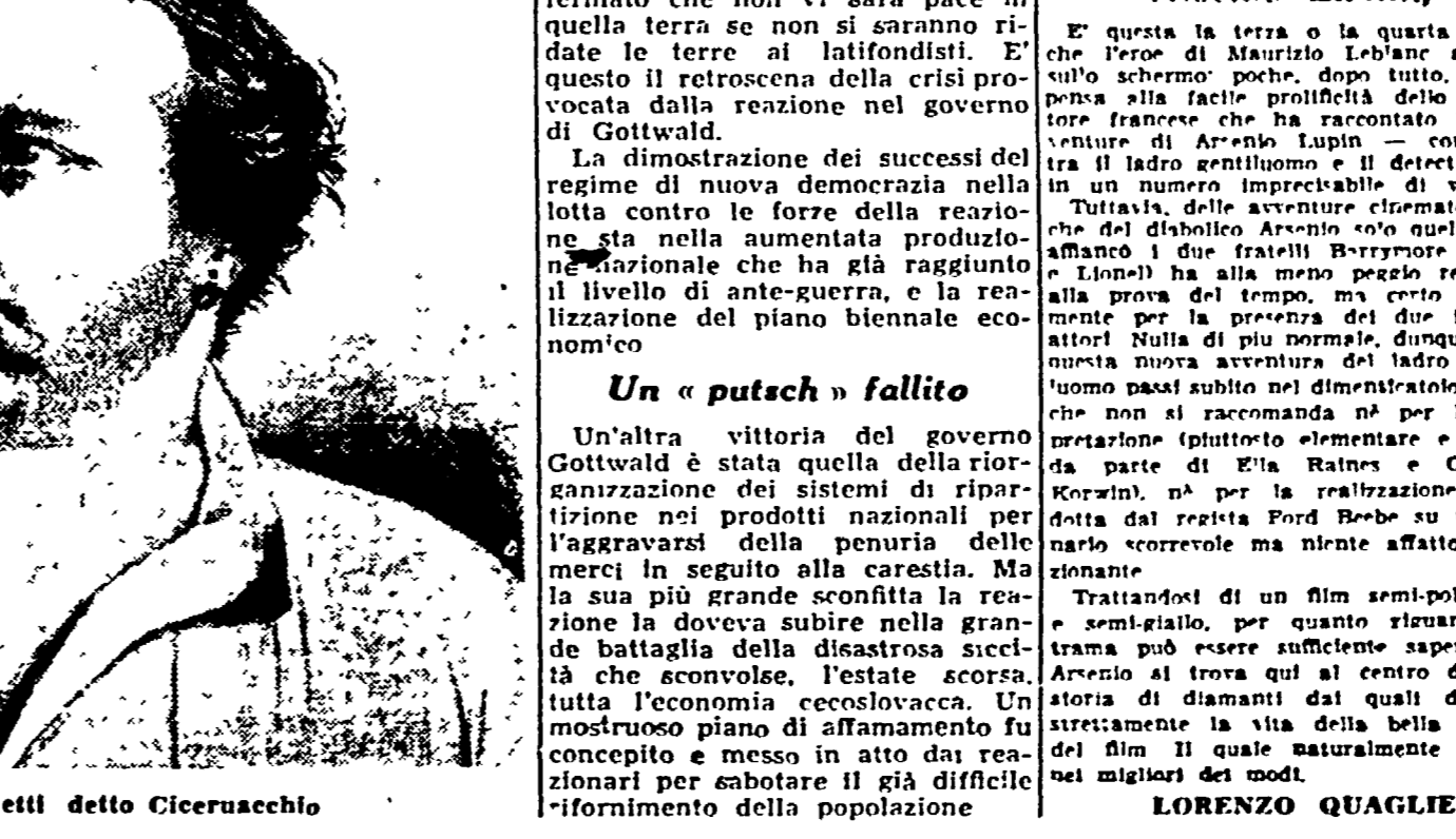
Angelo Brunelli detto Ciceruacchio