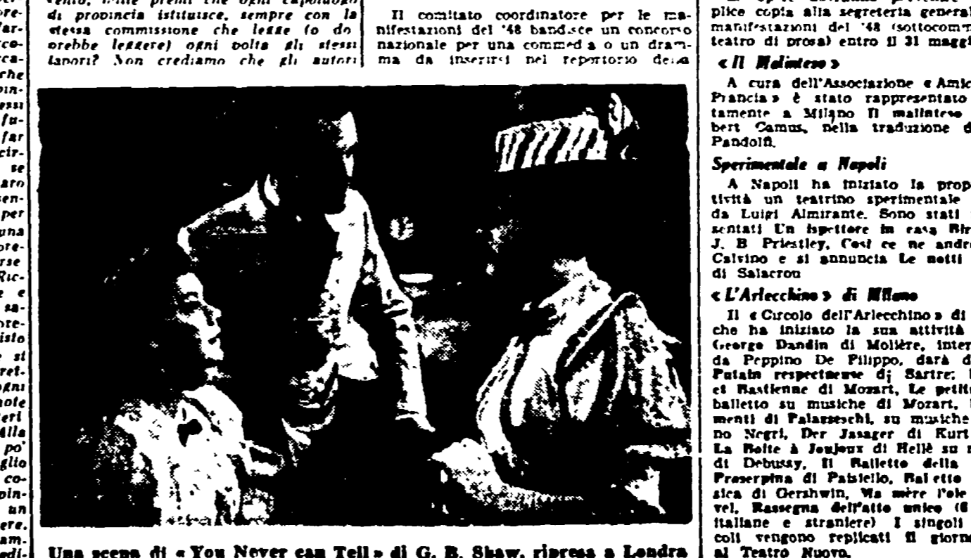
Una scena di "You Never Saw Tell" di G. B. Shaw, ripresa a Londra

« Quant'è affetti? Ma quello sera, non c'è che dire, c'era ragione il popolo di tutto Ciceruacchio. Gli ci corra ancora un anno per capitarci che Pio IX, oltre all'affetto dei suoi romani, aveva tanti altri affetti da accogliere sotto il suo manto, tra i quali non poteva o forse non voleva scendere... »