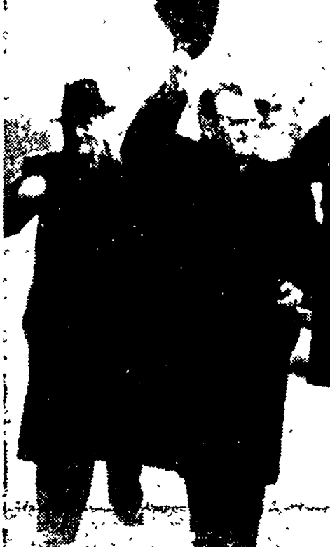
Klement Gottwald saluta la folla ammassata davanti al palazzo Kinsky. Alla sua destra il sindaco di Praga, Josef Kromer, e alla sua sinistra il ministro dell'Interno Nosek.