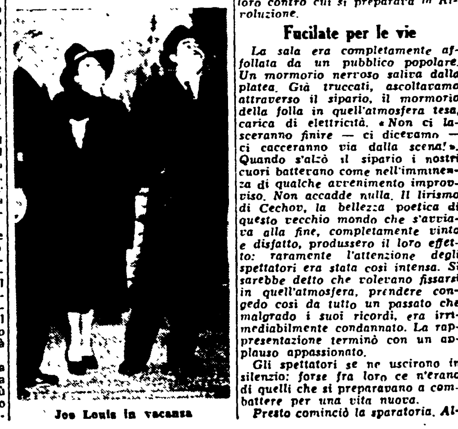
Joe Louis in vacanza