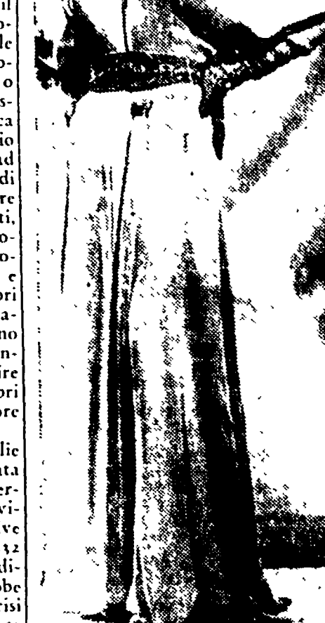
La giovane attrice Elizabeth Scott ed è già conquistata un notevole pubblico di ammiratori