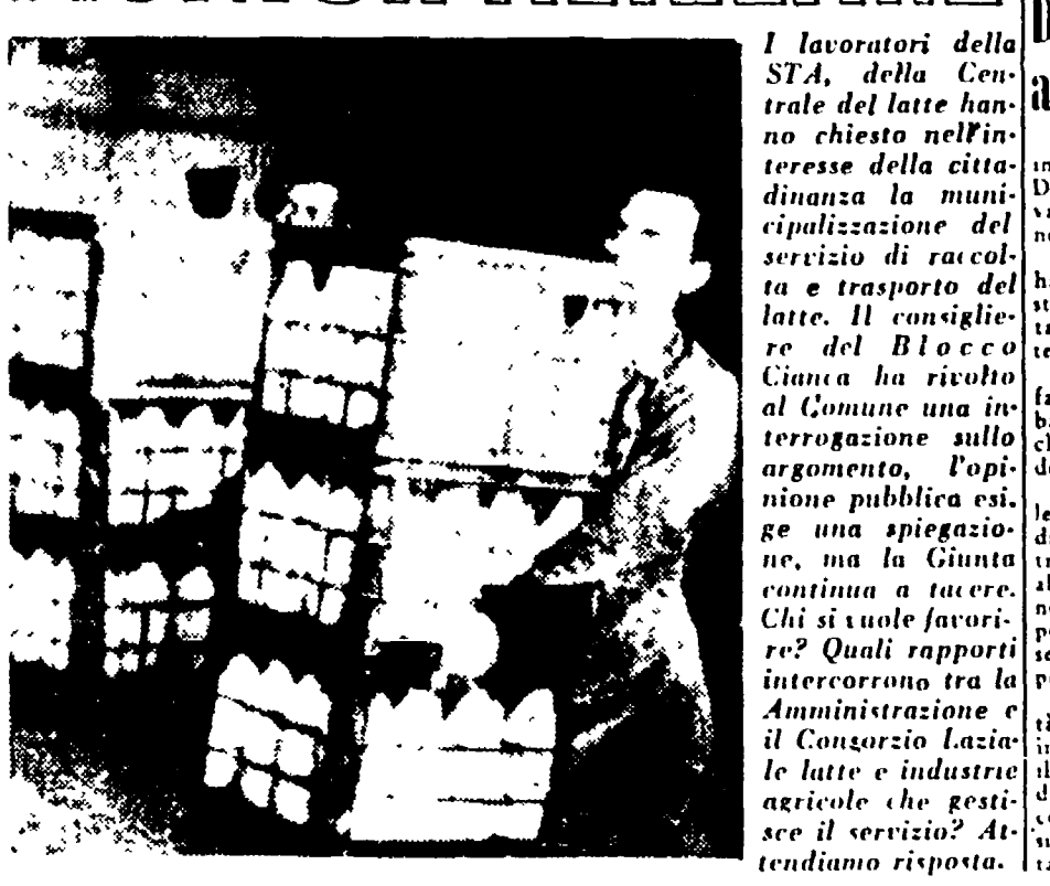
Nell'Agro Romano si sta organizzando in questi giorni sotto la guida del Fronte Democratico e della Comunità Popolare, un vasto movimento di Avanguardia Garibaldina, e di disoccupati.

Nell'Agro Romano si sta organizzando in questi giorni sotto la guida del Fronte Democratico e della Comunità Popolare, un vasto movimento di Avanguardia Garibaldina, e di disoccupati. A Grotta Lido una brigata garibaldina ha iniziato la demolizione della vecchia stazione petrolifera mentre un'altra brigata di disoccupati inizierà tra breve lo smantellamento dei ricoveri annessi. Una mattina al quartiere Appia la locale brigata garibaldina ha iniziato i lavori di sterco del terreno situato nei pressi di Appia Nuova e via delle Case per allestire un giardino pubblico a lavori non stati iniziati dopo che la Comunità Popolare del Quartiere aveva fatto numerose quanto inutili pressioni presso i competenti organi del Comune. La polizia di Scelba, con la tempestività che la contraddistingue in simili casi, ha invece disatteso la brigata, che porta il nome glorioso di Garibaldi Manelli, a disoccupati che lavorano in un campo continuo e continueranno al campo che in suo onore, forte dell'appoggio di tutta la popolazione.