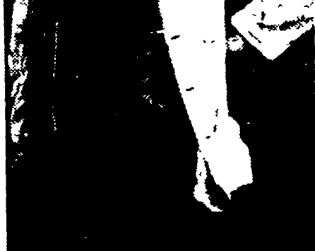
Costantino Stanislavski nella parte di Astrov nella "Zio Vanja" del Teatro d'Arte di Mosca