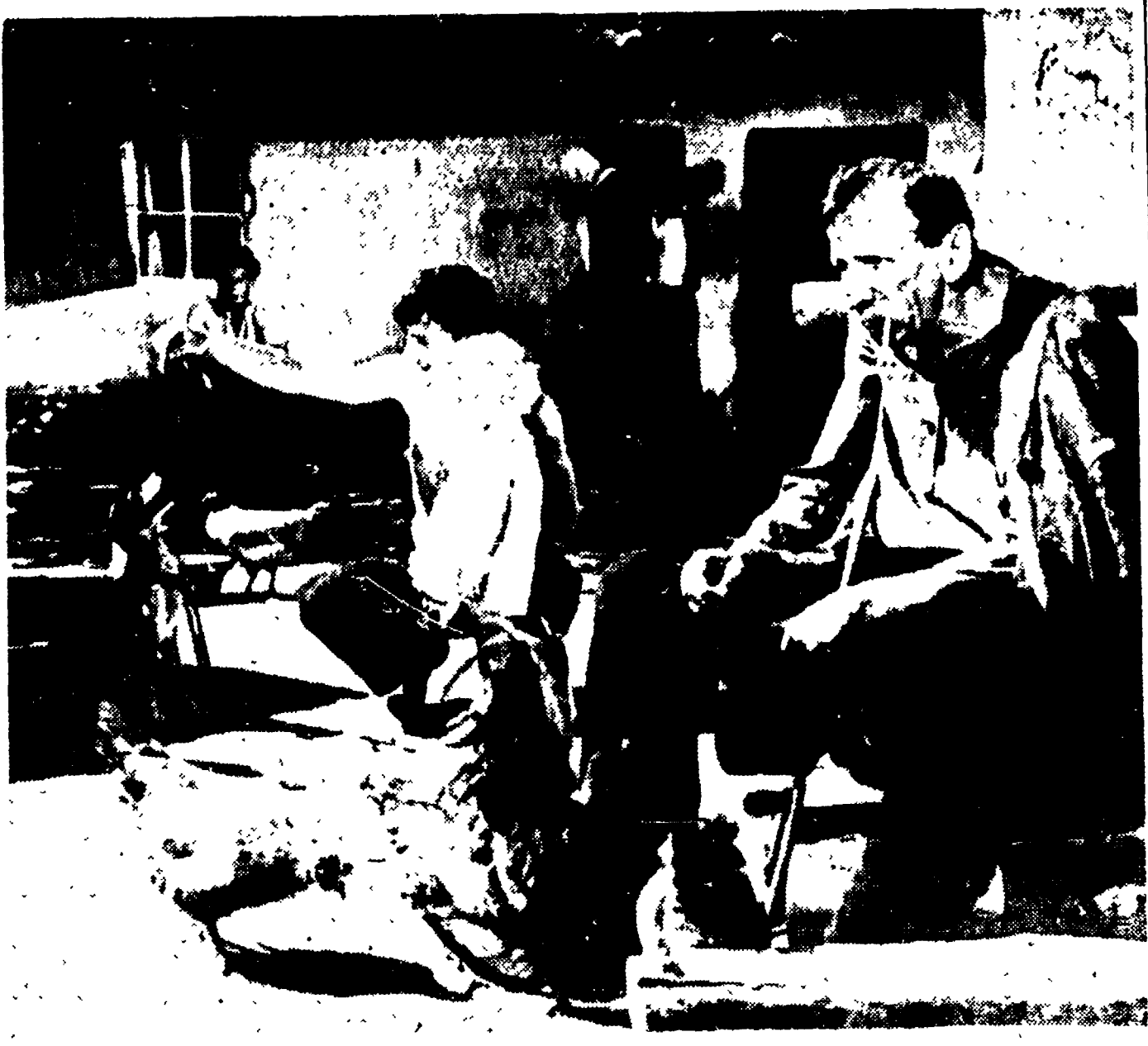
Una scena del film «La giovane guardia» di Sergio Gherassimov, tratto dal noto romanzo di Fadeev