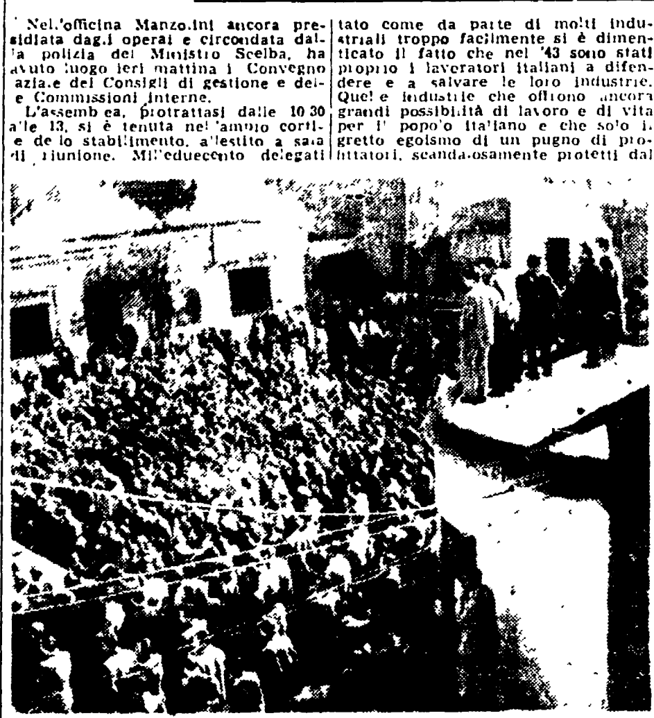
L'Assemblea del cortile della Manzolini durante il convegno dei delegati

1.200 delegati nel cortile della Manzolini presidiata dagli operai - La Confindustria inchiodata alle sue responsabilità