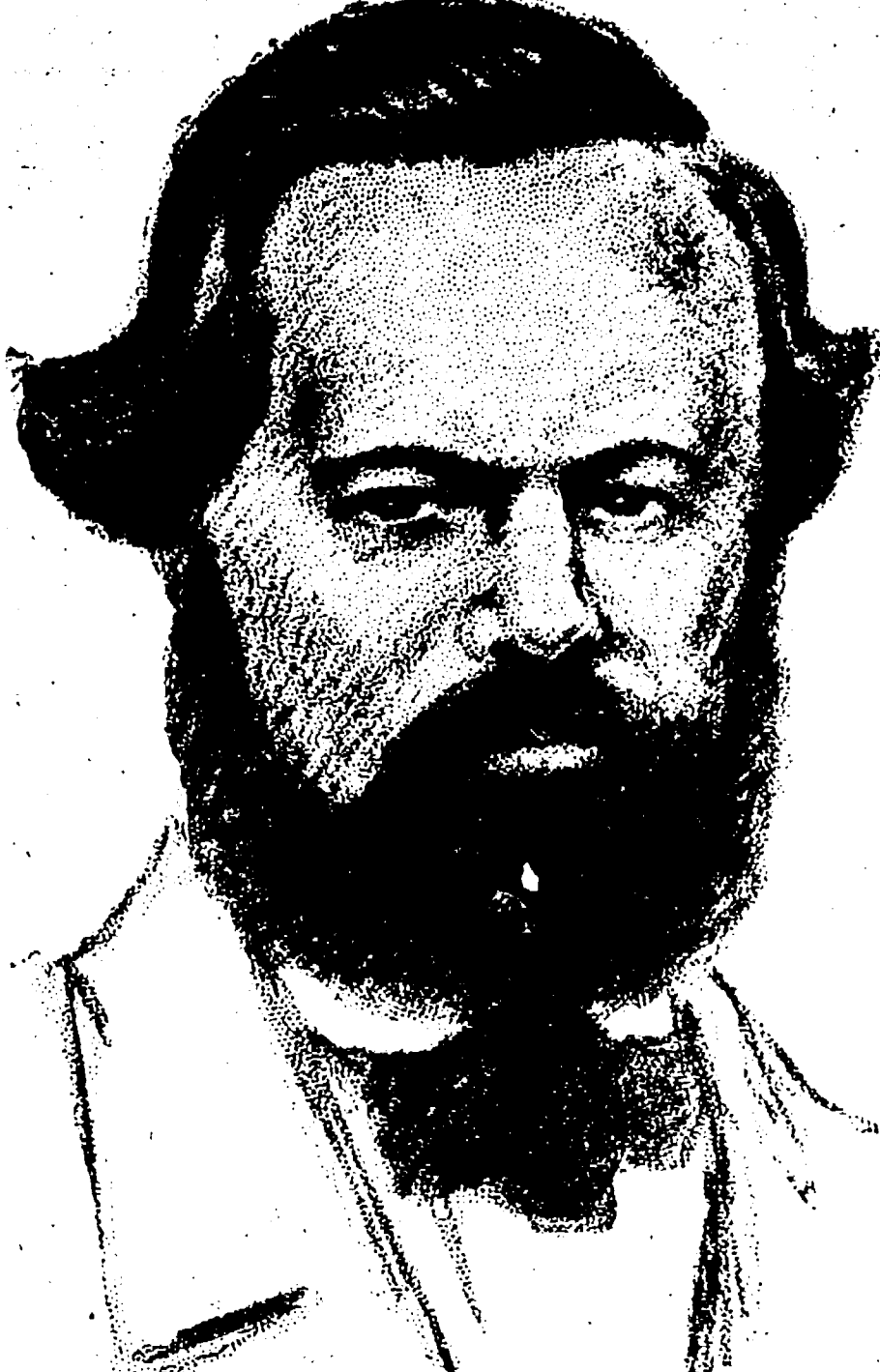
Ecco Carlo Marx com'era cento anni fa, nel 1818. Ricorre oggi il sessantaseiesimo anniversario della sua morte: alle ore 11.45 del 14 marzo 1883, assalito dalla moglie e da una delle figlie, al suo tavolo di lavoro, chiudeva gli occhi per sempre il Padre del Socialismo.

Ma l'ombra dei grandi alberi fini e si sentiva in un cespuglio corbezzolo, a una svolta, un altro volo di passeri, con gridi. Poi ritornò silenzio. Era forse un giardino abbandonato. Ma l'ombra dei grandi alberi fini e si sentiva in un cespuglio corbezzolo, a una svolta, un altro volo di passeri, con gridi. Poi ritornò silenzio. Era forse un giardino abbandonato. Ma l'ombra dei grandi alberi fini e si sentiva in un cespuglio corbezzolo, a una svolta, un altro volo di passeri, con gridi. Poi ritornò silenzio. Era forse un giardino abbandonato.