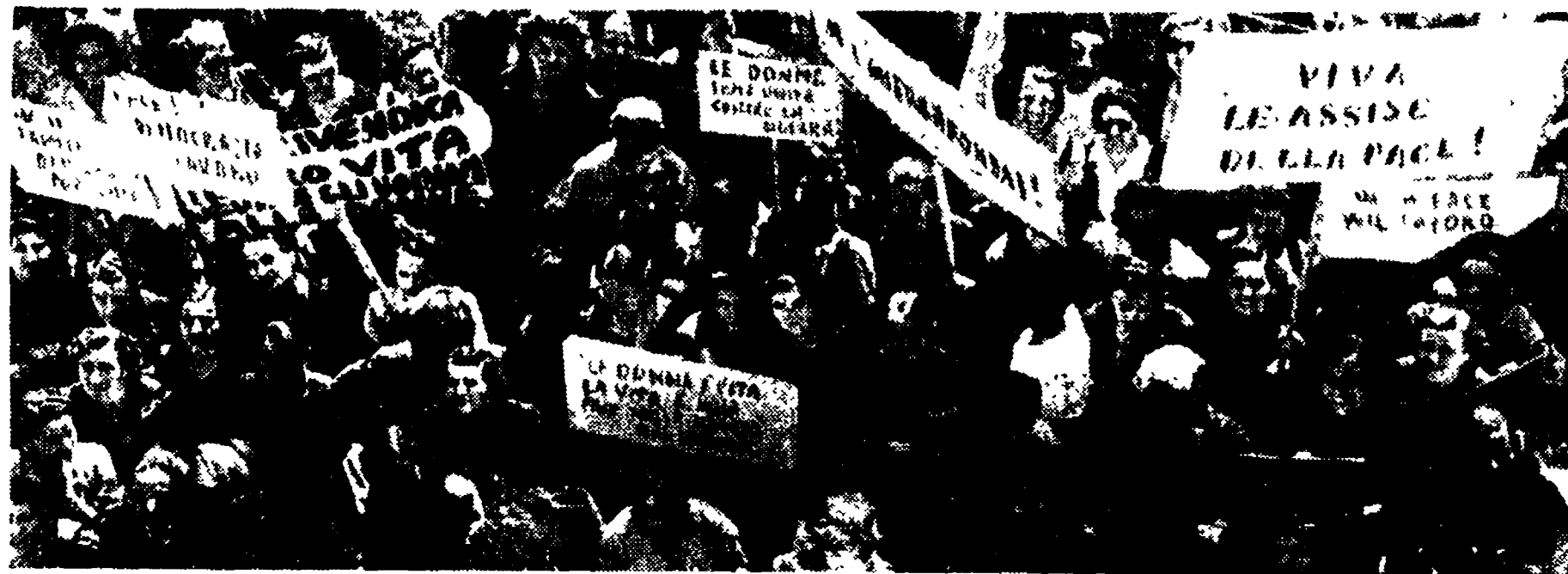
Da tutte le città d'Italia le donne, acclamando alla pace, hanno inviato a Roma le loro rappresentanti.

Trentamila donne convenute da tutta Italia nella Capitale - Umberto Terracini presenzierà la grande Assemblea - Il corteo delle madri, delle giovani, dei combattenti e dei mutilati dinanzi al Milite Ignoto