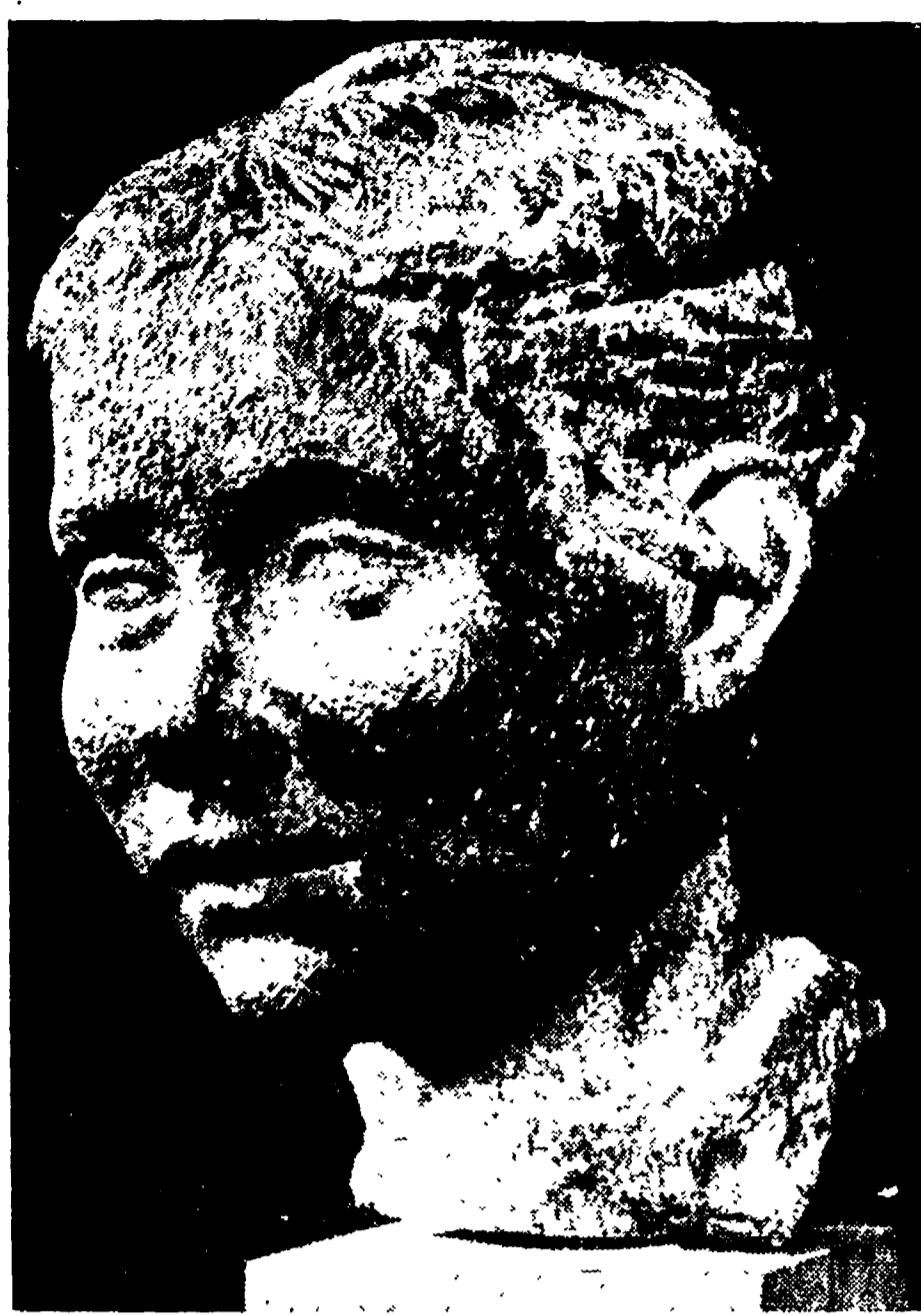
Quadriennale d'Arte Moderna - Andrea Spadini: Ritratto