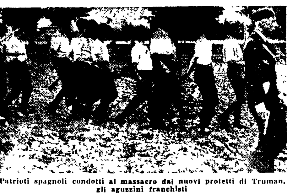
Patrioti spagnoli condotti al massacro dai nuovi protetti di Truman, gli aguzzini franchisti