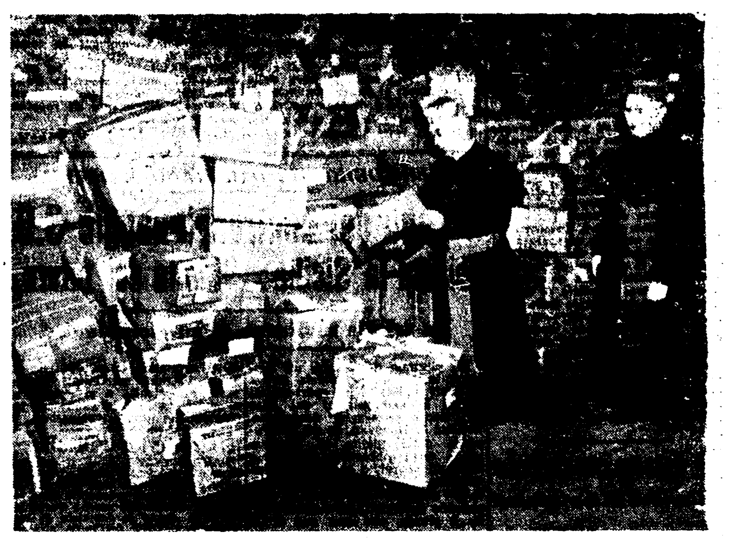
Il cardinale Spellmann controlla personalmente la spedizione al Vaticano e alla D. C. dei pacchi elettorali che dovrebbero servire a corrompere gli italiani. Zuppa in polvere, sigarette e gomma da masticare in cambio dell'adesione al blocco ameri cano e alla guerra