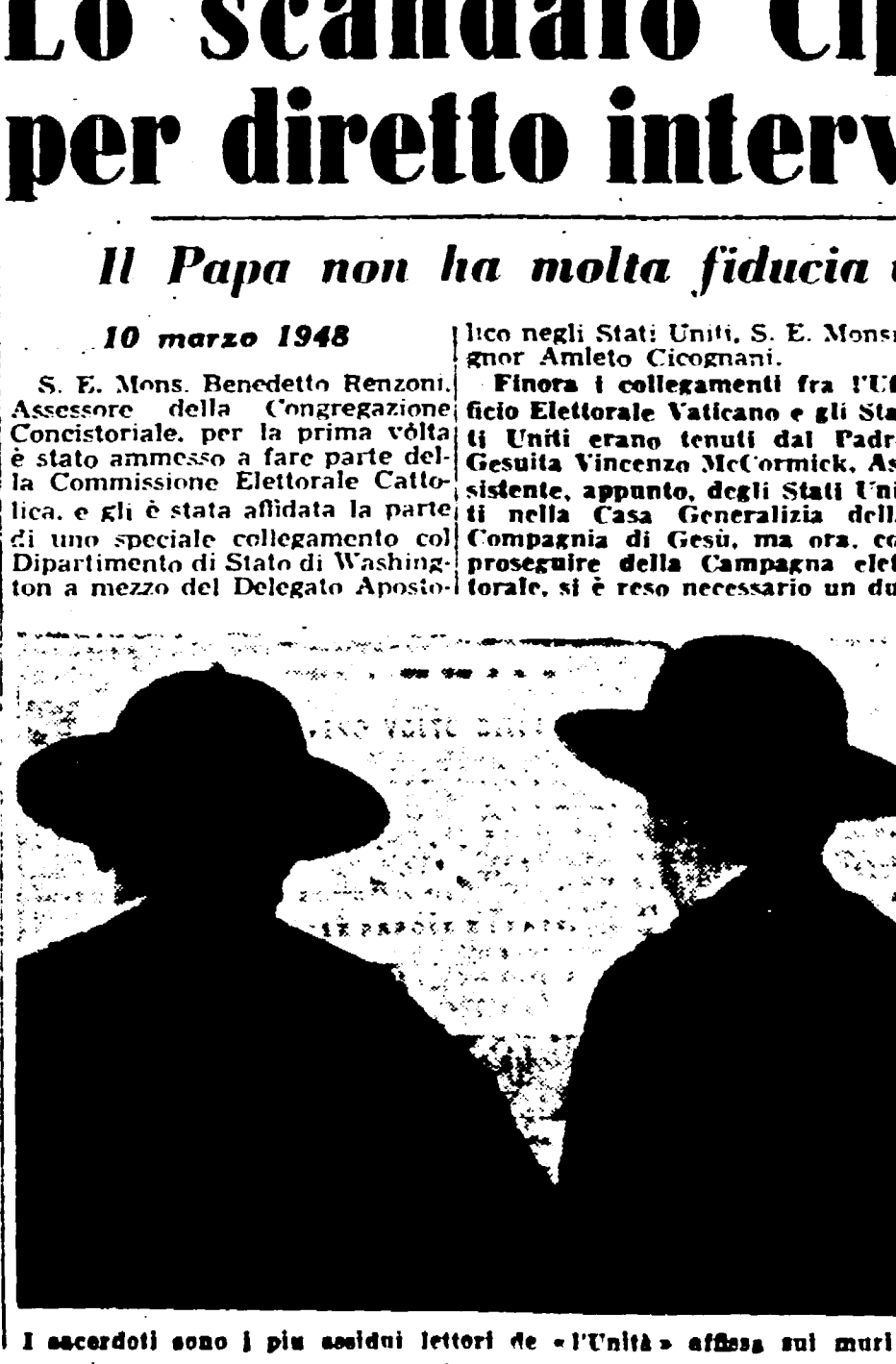
I accordi sono i più asidui lettori de "L'Unità" e affisa sul muro