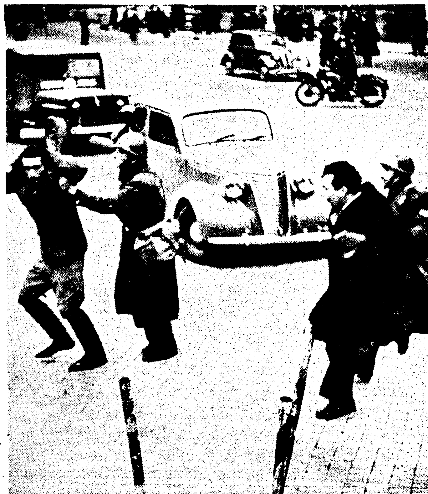
La polizia non c'è dove gli agrari e i fascisti sparano contro il popolo. Scelba la usa soltanto per arrestare e percuotere i mutilati, gli invalidi e i disoccupati.