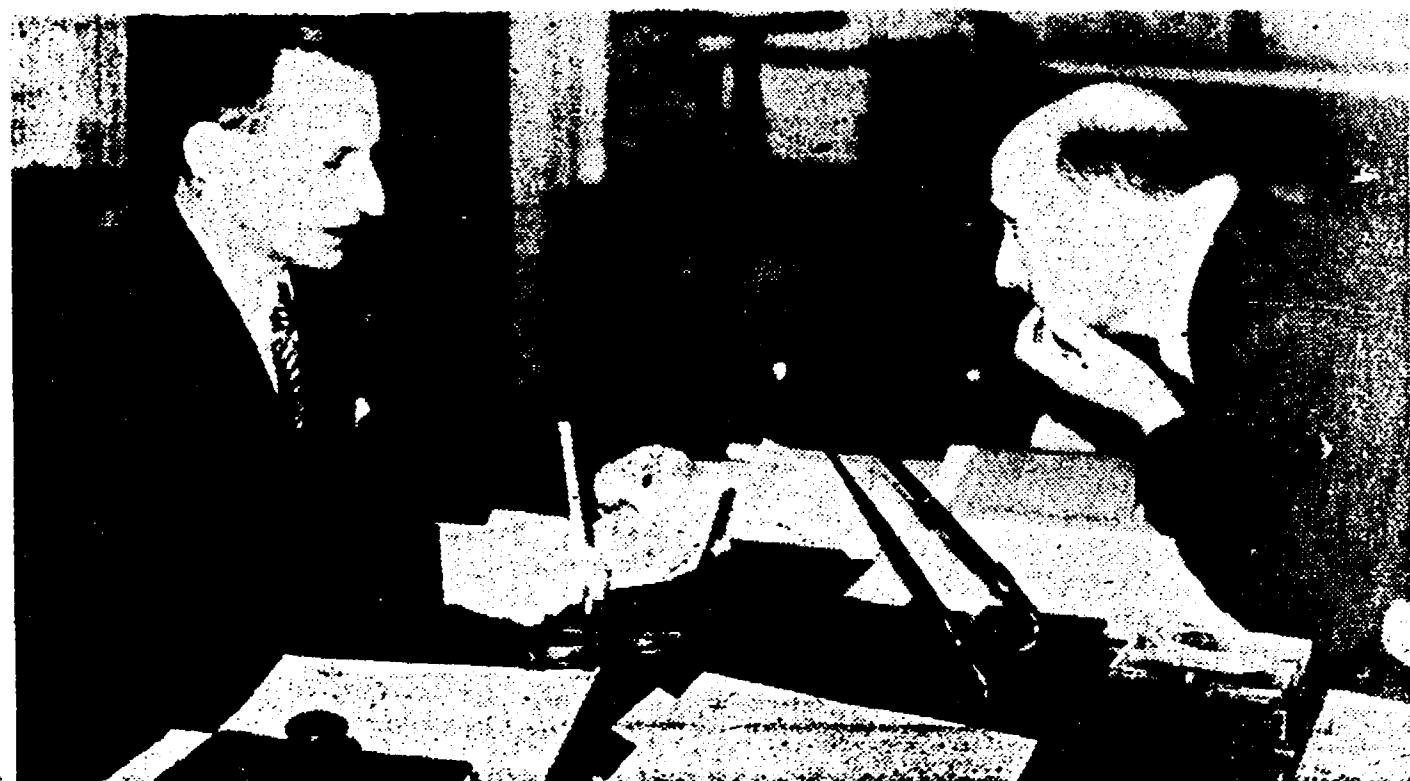
«Vincere. Così quel che costi» ha detto De Gasperi. E Scelba gli ha fatto eco. Con i risultati che tutti hanno potuto vedere in Sicilia e a Somaglia. Ma il 18 aprile farà giustizia.