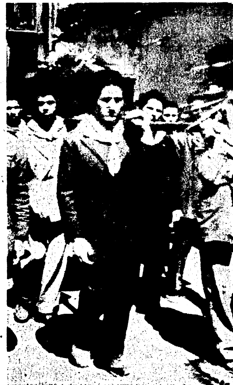
A Somaglia, come a S. Ferdinando, a Roma e dappertutto gli agrari hanno fatto scorrere il sangue e le bandiere del lavoro si sono inchinate davanti alle bare. Il 18 Aprile il popolo spazzerà via il governo nero,

Contro il governo della discordia VOTATE FRONTE POPOLARE!