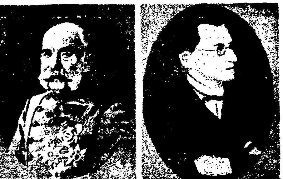
DUE RITRATTI - A sinistra, Francesco Giuseppe; a destra, il suo fido deputato De Gasperi. Noi ci fidiamo, Von Gasperi - disse Cesare Battisti della nostra cosa di superuomo »

« E' lui, E' lui che nel Parlamento di Vienna legge la sacra formula... l'imperatore è grande. Ma Alcide è immenso... Il trenta maggio 1917 il "Provisorischer Schriftführer", gridò "evviva... al kaiser e alla kaiserin" »