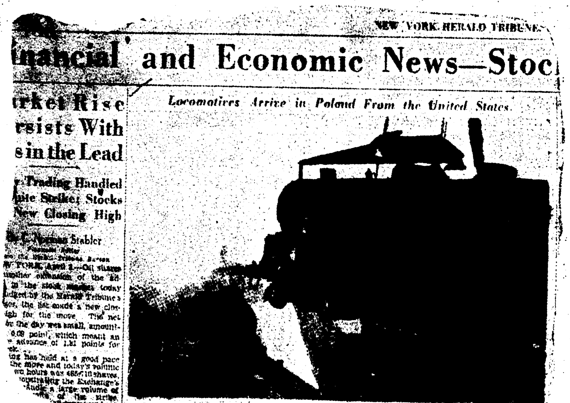
Il New York Herald Tribune pubblica con grande rilievo la foto di locomotive USA scaricate in un porto polacco. I traffici fra Stati Uniti e Polonia sono attivissimi

Il prezzo del grano russo è pari alla metà di quello americano. E non viene pagato in dollari ma in merci.