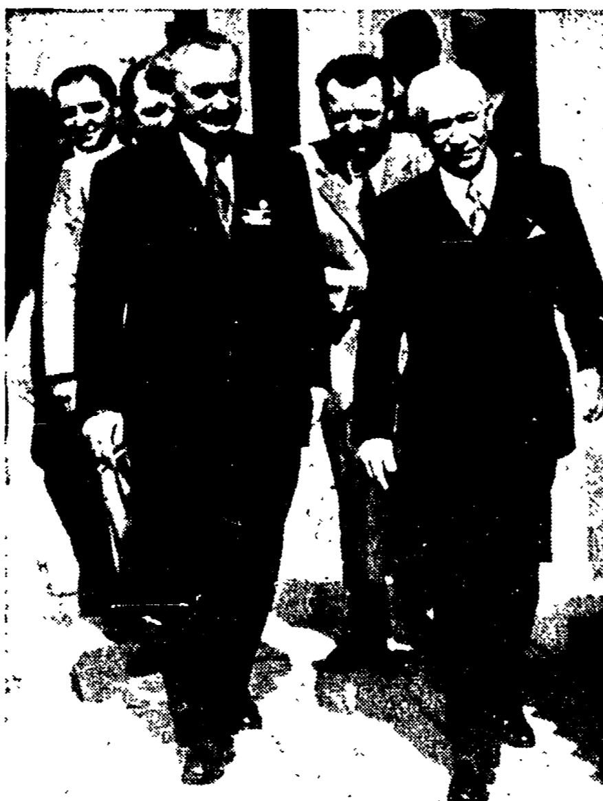
Il Presidente della Repubblica Cecoslovacca, Benes, riceve nella sua residenza di Servimovo Usti il Primo Ministro Bulgaro, Dimitrov. Nella foto, dietro Benes e Dimitrov, si vedono Goltwald, Primo Ministro cecoslovacco e Clementis, Ministro degli Esteri cecoslovacco.

Dichiarazioni di Marshall La risposta alla domanda del Senatore Jenner, per sapere «cosa vi fosse di comune fra tabacco, ricor-