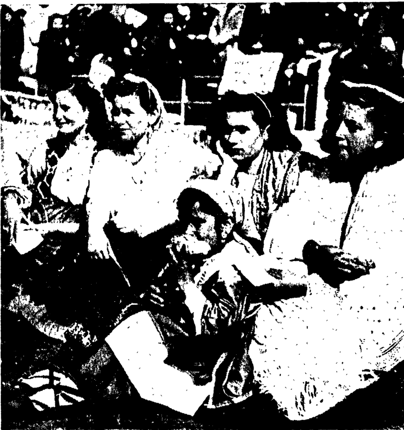
Donne ciondolare ad una festa in costume