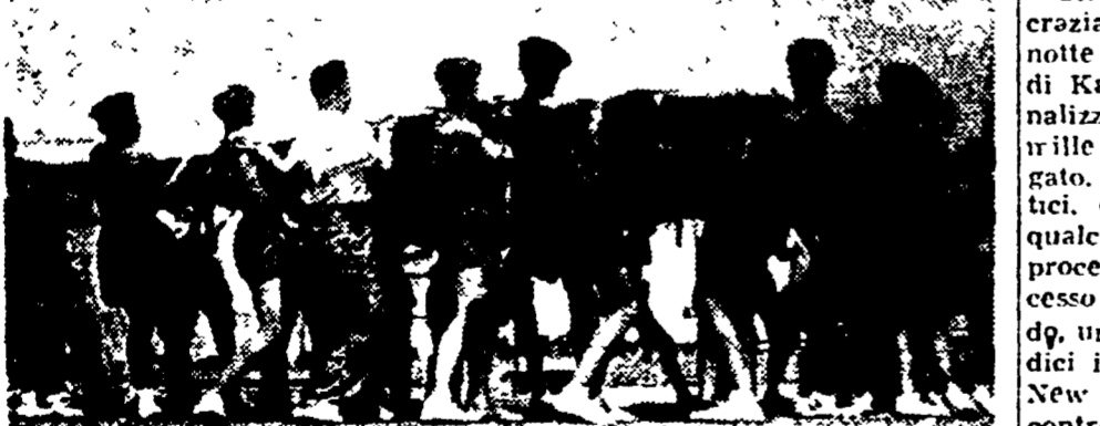
Ginnastica all'aperto a Praga