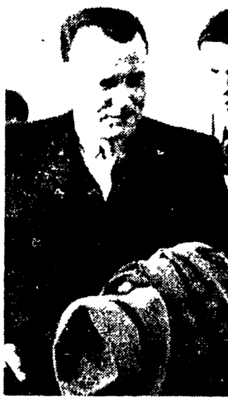
Il vice ministro sovietico, Malik.

WASHINGTON, 15. — Si è imbarcato oggi sul transatlantico Queen Mary a Southampton in Inghilterra, il vice ministro degli Esteri Sovietico Malik, giunto nella giornata di giovedì a Londra.