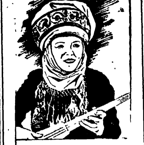
scorribanda nel paese dei soviet

«Come si vive oggi in Russia. Una libera esposizione corredata da fotografie, che piacerà a tutti».