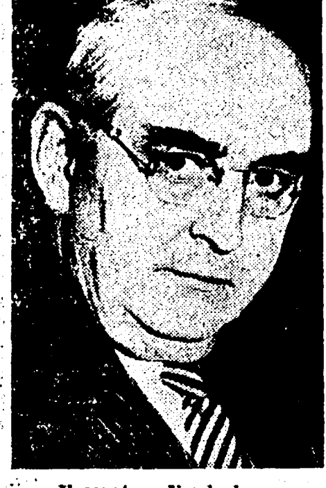
Il senatore Vandenberg