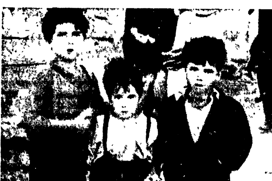
Anche ieri alla Presidenza del Consiglio non sono state ricevute le delegazioni di mogli di disoccupati interessati all'assegnazione di fondi per le colonie estive degli organismi democratici della Provincia.

«Il «basta» dei minatori agli industriali che smobilitano» La grave situazione dell'industria mineraria in Italia è stata dibattuta in una conferenza stampa che ha visto la partecipazione di una delegazione nazionale e romana della F.I.L.E. al di là di una semplice discussione, ma di una discussione che ha visto la partecipazione di una delegazione nazionale e romana della F.I.L.E.