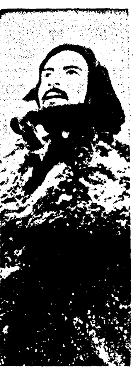
Lunedì prossimo verrà presentata a Roma il grande film sovietico di M. Ciaurelli «Il Giuramento», di cui la fotografia che pubblichiamo mostra un forte scorcio d'inquadratura.