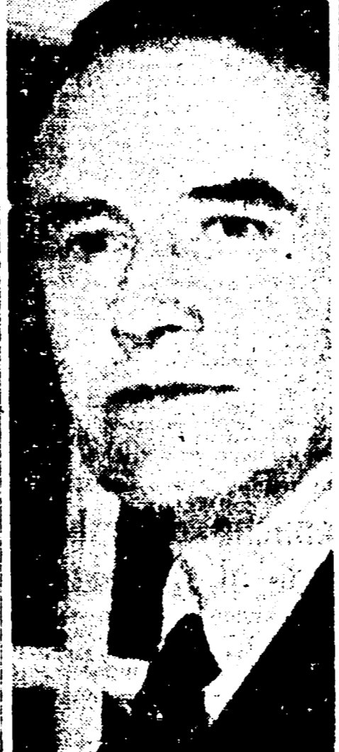
Walter Harriman, l'ambasciatore volontario a Roma del piano Marshall.

Harriman aveva grossi interessi in Europa. Harriman aveva grossi interessi in Europa. Harriman aveva grossi interessi in Europa. Harriman aveva grossi interessi in Europa.