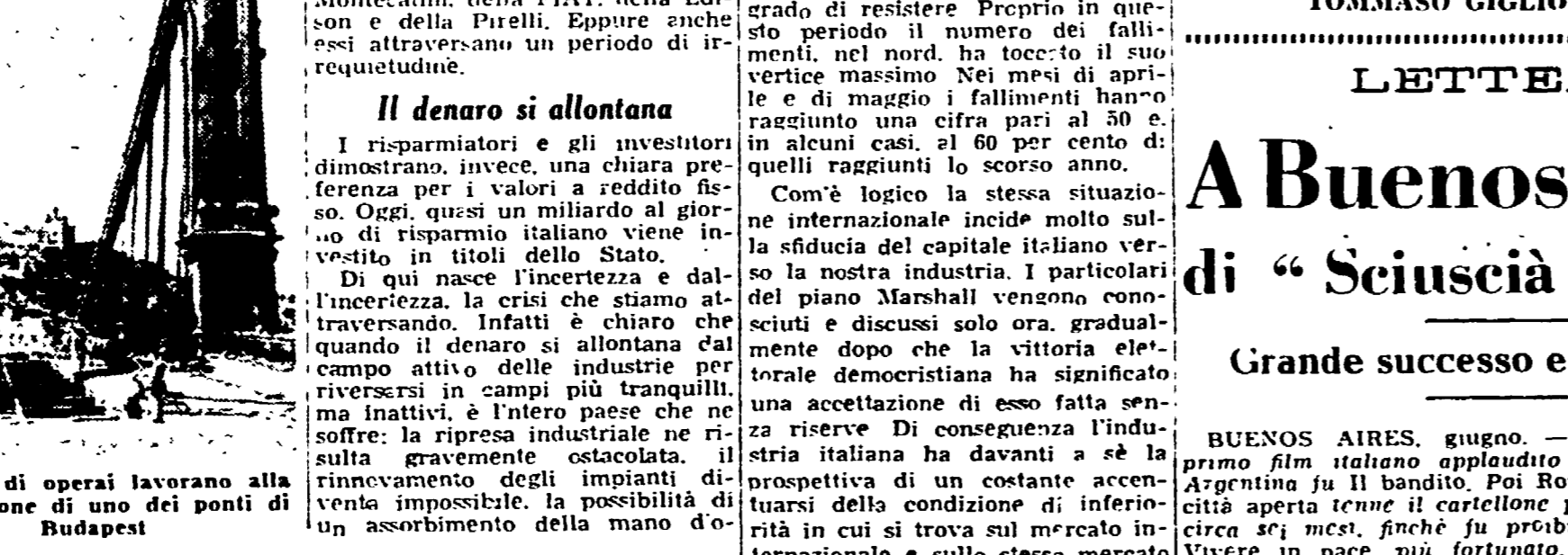
Squadre di operai lavorano alla sistemazione di uno dei ponti di Budapest

Verso la fine di aprile è incominciata, alla borsa di Milano, e poi quella di Torino e di Genova, una discesa dei titoli industriali che ha meravigliato tutti. Fu un fenomeno che si trattasse di un fenomeno transitorio. Durante il mese di maggio la discesa ha assunto forme persino paurose. Molti pensavano che si trattasse di un fenomeno transitorio, maggiore ragione, esso sarebbe continuato dopo l'esito delle elezioni. Invece il 20 aprile i titoli industriali toccarono la loro punta massima, poi cominciarono a discendere; la discesa era stata di breve durata, anche perché adesso si venivano a conoscere alcuni aspetti concreti del fenomeno. Durante il mese di maggio la discesa ha assunto forme persino paurose. Molti pensavano che si trattasse di un fenomeno transitorio, maggiore ragione, esso sarebbe continuato dopo l'esito delle elezioni. Invece il 20 aprile i titoli industriali toccarono la loro punta massima, poi cominciarono a discendere; la discesa era stata di breve durata, anche perché adesso si venivano a conoscere alcuni aspetti concreti del fenomeno.