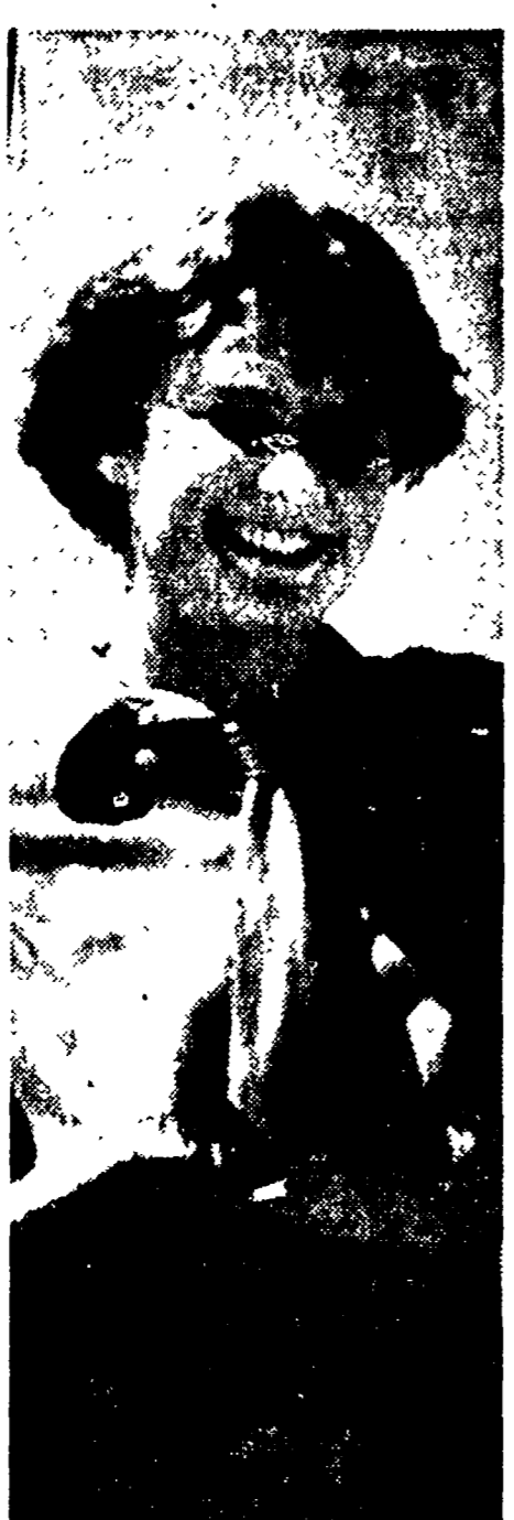
Una giovane contadina polacca costata dall'obiettivo durante una grande festa popolare svoltasi recentemente. La gioventù polacca, superate le tremende prove della guerra e della ricostruzione del paese devastato, guarda con sorridente fiducia al proprio avvenire

L'Osservatore Romano risponde a un mio articolo comparso sul nostro giornale dal titolo "La doppia verità dei padri gesuiti". Nella mia nota io mi ero riferito, come qualche attento lettore ricorderà, al clamoroso intervento del clero italiano nelle recenti elezioni. Avevo affermato che la propaganda elettorale di cui i reverendi padri erano stati tanto parte, era stata condotta in base a un radicale anticommunismo di natura chiaramente volgare. Nel stesso tempo, tenendomi presente un articolo di padre de Vico comparso sulla "Civiltà Cattolica" del 15 maggio nel quale si dice che la Chiesa in Russia è preletta dallo Stato, avevo messo in evidenza il doppio modo di comportarsi dei gesuiti di fronte a un medesimo problema.