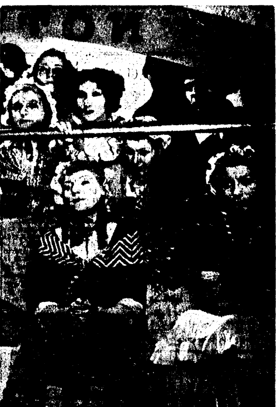
Anche le figure delle "comparse" no "La Marsigliese" sono i dimenticabili: volti e animati toccano il cuore degli spettatori