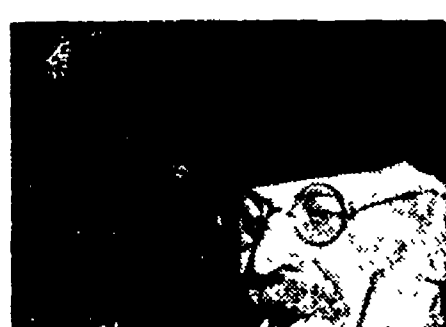
Nella Germania occidentale i cittadini possono accendere la pipa coi biglietti di banca: il marco non vale più nulla