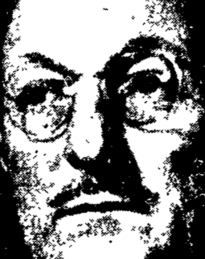
Il «boss» del Far-West è venuto a Roma, per delirare a De Gasperi la politica economica del governo italiano